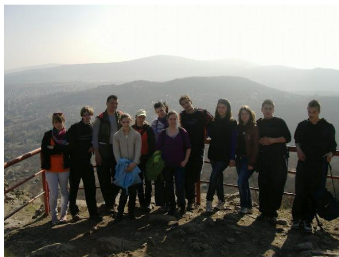
Petőfi kilátó - Kő-hegy

Innen lefelé, Pomáz városába vitt az utunk. A célban jól esett a zsíros kenyér hagymával valamint a frissítő tea. Az idő gyönyörű volt, és 7 és fél óra alatt sikerült a 24 km-es távot teljesíteni.