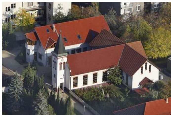
Egy légi felvétel templomunkról és a gyülekezeti házról

Április 8-9. Húsvét, úrvacsorával egybekötött ünnepi istentisztelet az énekkar szolgálataival.