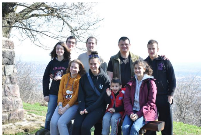
a túrázó fiatalok

ápolni szolgáló túrán, amely minden évben megrendezésre kerül. Reggel indultunk útnak a Pannontelepi hévállomástól. A 12 km-es táv megtételét nehezítette az előző napok esőzéseinek maradványa, az utakat elborító sár. Mikor szárazabb talajt értünk, a csodálatos erdei tájban is gyönyörködhettünk.