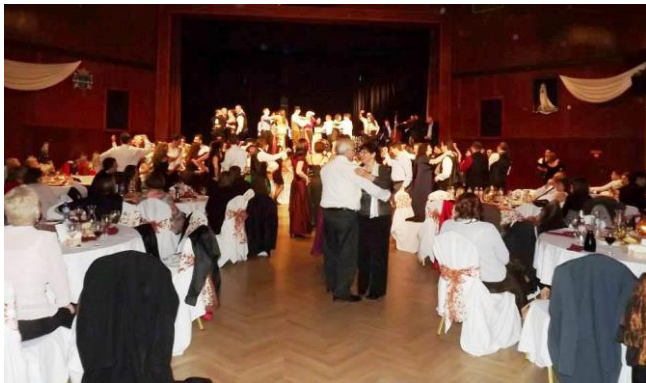
táncol a báli közönség

2014. február 12-én megrendezésre került a gyülekezetünkben működő Kapunyitás alapítvány által szervezett református bál. Befogadó közösség lévén nem csak gyülekezeti tagok, de számos vendég is megtisztelte jelenlétével az eseményt. Fővédnökünk a Parlament elnöke, dr. Kövér László volt. Jótékonysági bálunk célja nem csak az, és a jövőben sem csak az lesz, hogy az Úrkúton épülő konferencia- és ifjúsági központ megépüljön, hanem szeretnénk a nagyobb nyilvánosság előtt is bemutatni azt, hogy lehet egy keresztyén közösségben is kulturált formában bálozni. Természetesen az elsődleges célunk mindig az, hogy gyülekezetünk életét, jövőjét, álmainkat segítse az ilyen esemény. Milyen is volt az est? Röviden: áldott, a célja miatt. Áldott, mert több korcsoport, fiatalok és idősebb "örökifjak" együtt tudtak örülni, táncolni, beszélgetni. Csupa jókedvű, jó szándékú, magát jól érezni akaró arcot láthattunk. Szabad-e nekünk keresztyéneknek "bulizni", táncolni, szórakozni? Nos, azt gondolom, hogy igen, bizonyos szabályok betartásával. Isten azt akarja, hogy jókedvűek és vidámak legyünk, de csak annak tudatában, hogy annak célja van és mi a célunk azzal. Ha keressük Isten szándékát, jó, ha megvizsgáljuk, beilleszkedik-e bálozásunk az ő terveibe, akaratába. Tudjuk, mi a cél? Igen, konferencia- és ifjúsági központ Úrkúton! Tudjuk-e, hogy kedves ez Isten számára? Meggyőződésünk, hogy igen,