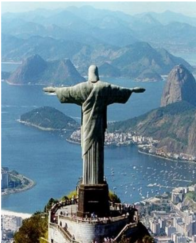
A Megváltó Krisztus szobra Rio de Janeioban

Jeruzsálem azonban megölte a prófétákat! Amikor azonban „betelt az idő”, már angyalok mondták a jó hírt Jézus születéséről - Józsefnek és Máriának, majd a betlehemi éjszakában a pásztoroknak. A menny, Isten országa jött tanúbizonysággal! S amikor Jézus földi útja végéhez közeledve készült a Golgotára, gyötrődésében angyal erősítette őt, majd feltámadása reggelén a sírhoz érkezők is angyaltól hallják a győzelmes jó hírt: „nincsen itt, mert feltámadott”. „Ne keressétek a halottak között az élő!” „És ne féljete!” Sőt menjetek Galileába - mondta a Feltámadott- és ott mindnyájan megláttok engem. És minden pontosan úgy történt, ahogy a próféták előre meghirdették, ahogyan az angyalok bejelentették. Húsvét a prófécia és az angyalok pecsétje, keresztyén hitünk végső kiteljesedése. Hálaadással örvendezünk ezen egyéni, családi és gyülekezeti életünkben.