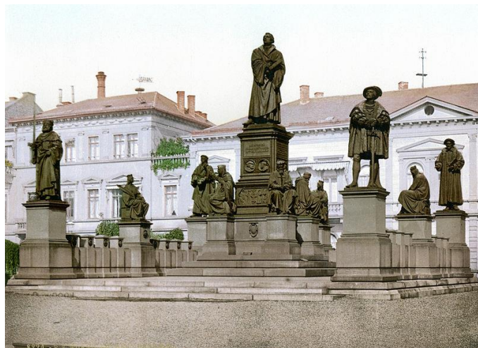
Luther emlékmű Wormsban „Itt állok, mást nem tehetek”

Luther Mártont és tanait elítélte a Worms-i Edictum.