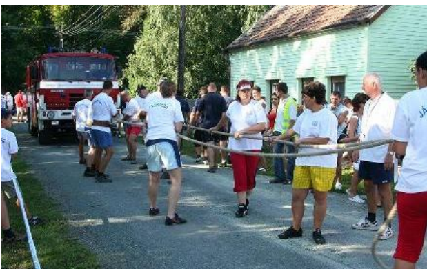
„Húzzad jobban...!” - kamion helyett a tűzoltóautót is