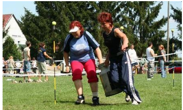
Egységben az erő