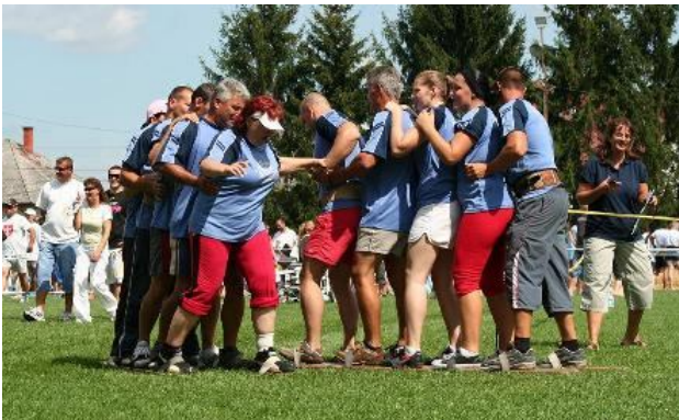
Sítalpakon a csapat