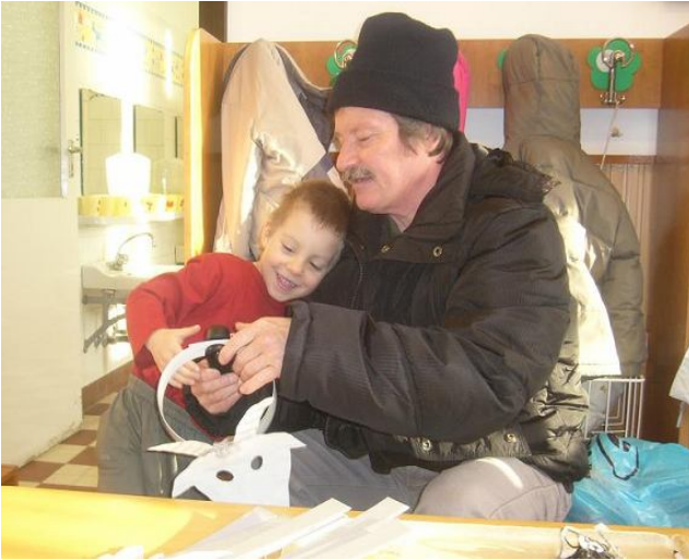
Kecske a készülő szakállát rezegteti

Farsang farka a negyven napos húsvét előtti böjti időszakot megelőző napokon szokott megrendezésre kerülni. A farsangi alakoskodás a tavaszra készülődés az állatok életmódján, szokásain keresztül dalok, versek, versengések segítségével idézi meg a tavaszt. Az állatos fejdíszek, jelmezek évek óta a szülők segítségével készülnek