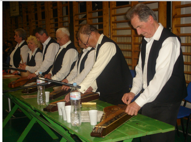
A Jászkun Citerazenekar Szolnokról