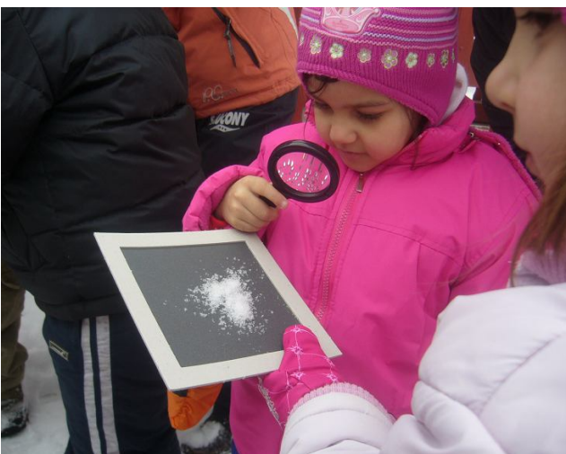
Milyen is a hó?

„A természet hatalmas, az ember parányi, ezért aztán az ember léte attól függ, milyen kapcsolatot tud teremteni a természettel,”