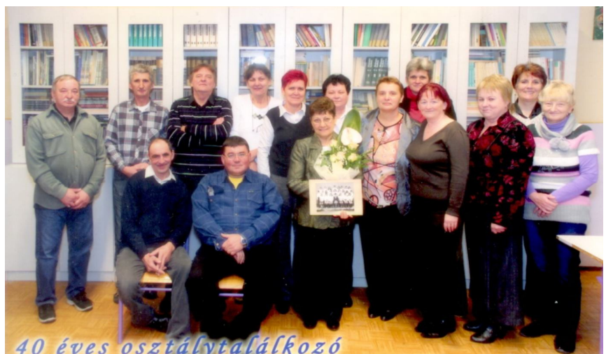
40 éves osztálytalálkozó

Tóth Béláné osztályfőnök részvételével megtartottuk