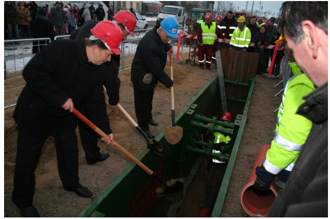
Az ünnepi programokat december 14-én egy hivatalos ceremónia előzte meg, a jánoshidai szennyvízhálózat első elemének ünnepélyes letétele.