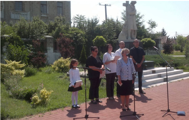
A trianoni megemlékezés szereplői