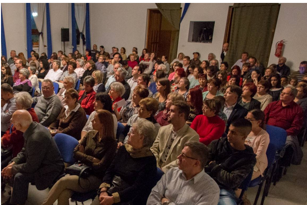
Teltház a faluszínház második előadásán (Nagyabonyi Színkör: Bújócska)