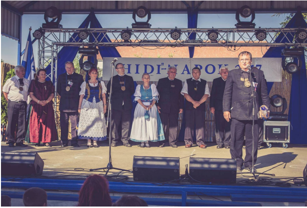
Jászsági polgármesterek a HIDI-napokon