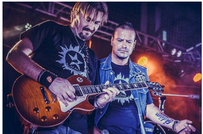
Pillanatkép az I. Zagyvartéri nyárzáróról