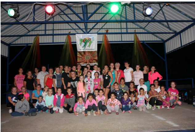
A legsportosabb hidaiak: mozgások éjszakája