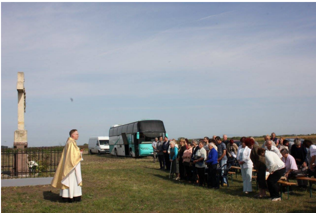
Szentmise a tótkéri emlékhelyen