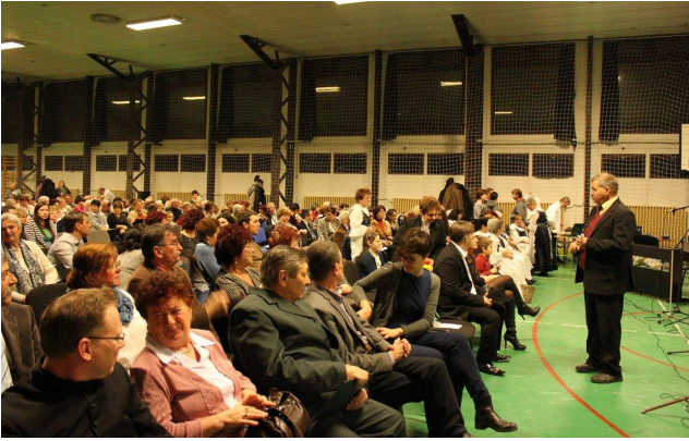
A jánoshidai előadók jótékonysági estje