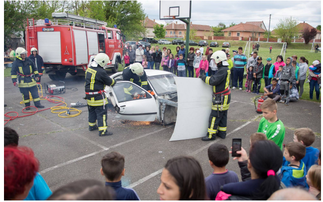
Tűzoltó-bemutató a családi napon