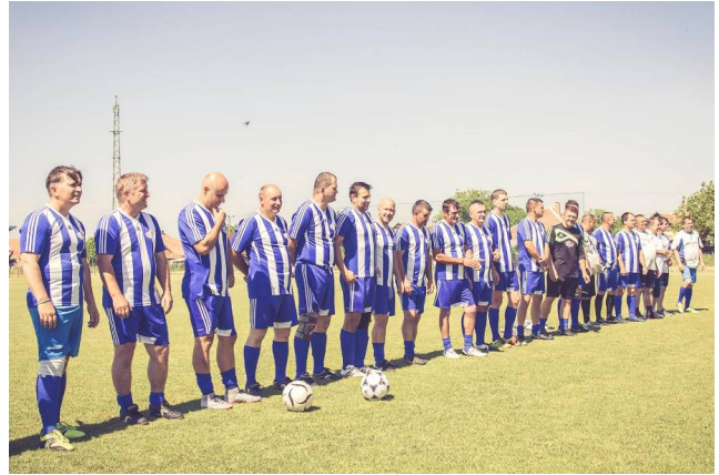
A hidai „öregfiúk” csapata