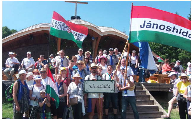
Jánoshidai zárandokcsoport Csíksomlyón