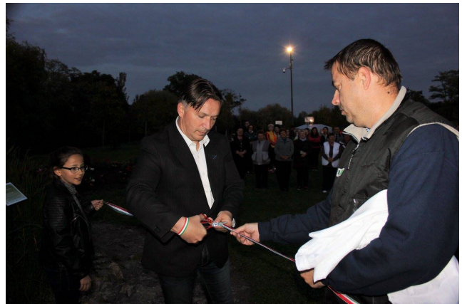
A MOL Zöldövezet program zárása: parkátadó