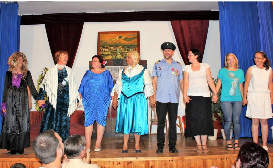
A Jánoshidai Felnőtt Kamarakórus műsora a HIDI-napok előestéjén.