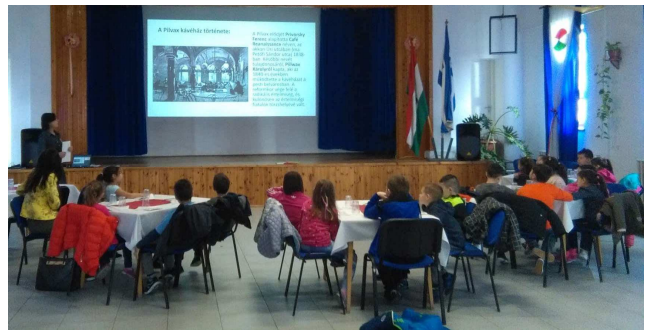
Megelevenedett a Pílvax Kávéház a Petőfi-béten (lent)

A Verseggy Ferenc Könyvtár munkatársaival folyamatos a kapcsolattartás, nekik köszönhetjük ebben az évben egy remek Bábelőadás megtekintését, a márciusi ünnepkörben a Pílvax Kávéház műsorát, illetve az Internet Fiesta 2019 programban is részt vettünk.