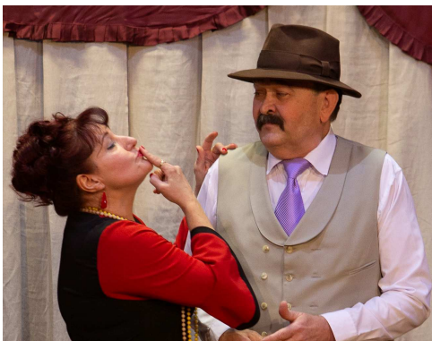
A Hyppolit, a lakáj is nagy sikert aratott

Mivel is zárhatnám a soraimat? Köszönjük, hogy ilyen sokan látogatnak bennünket, részt vesznek programjainkon, használják szolgáltatásainkat. Mindenkit várunk és visszavárunk.