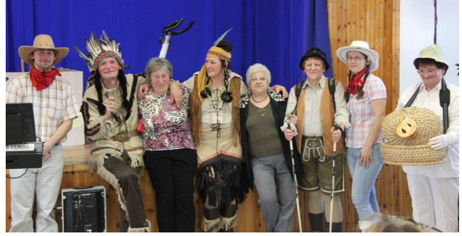
Farsangi hangulatban a nyugdíjas klub tagjaival

Az első hónapok az Újév köszöntésével, majd a farsangi időszak zibongásával kezdődött. Pályázunk. Pályázunk és pályázunk, hisz ezekben látunk lehetőséget a területek fejlesztésében. Ha nyerünk, boldogok vagyunk, ha nem, nem adjuk fel.