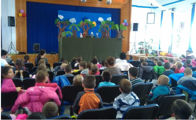
Bábelőadáson a kicsik (balra)