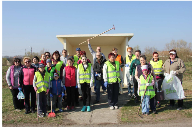
Márciusban csatlakoztunk a „TeSzedd!” mozgalomhoz