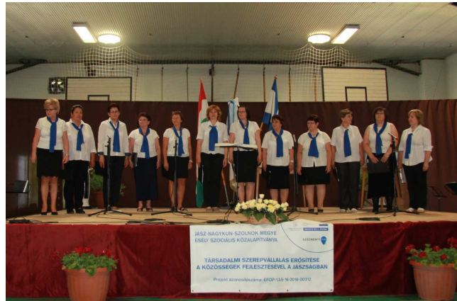
A falunapi dalos találkozón fellépett a Felnőtt Kamarakórus is