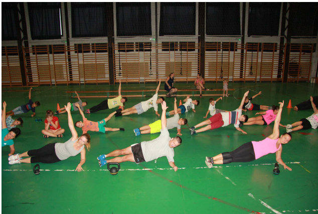
Mozgások estéje a Falubáz és a 3x1 csoport szervezésében