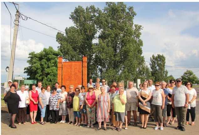
A HIDI Napok nyitórendezvénye volt a faragott Jánoshida-címer átadása a Túláton