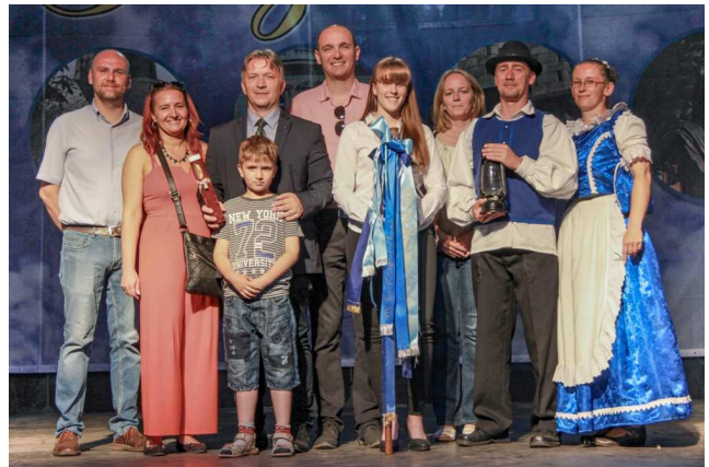
A Jászkeséren megrendezett Jász Világtalálkozó zárórendezvényén Jánoshida küldöttsége átvette a stafétát