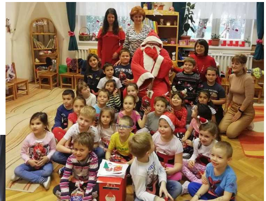
A Micimackó csoport