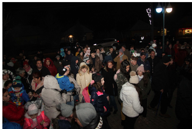
Az Adventtől Karácsonyig 2019. programsorozat a fénygyújtással kezdődött december 5-én

A Jánoshidai Polgárőr Egyesület köszönetét fejezi ki mindenkinek, aki támogatásával segítette az egyesület működését.