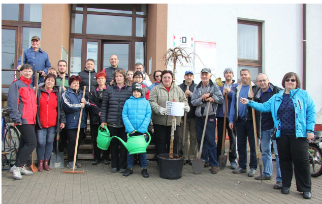
Csatlakoztunk az „Ültess 10 millió fát mozgalomhoz”