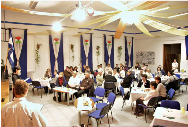
Pihax est a Falubázban március 14-én