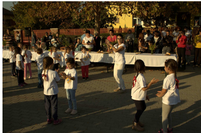
Töklámpás parádé az óvodában