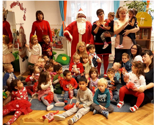
A Napsugár csoport