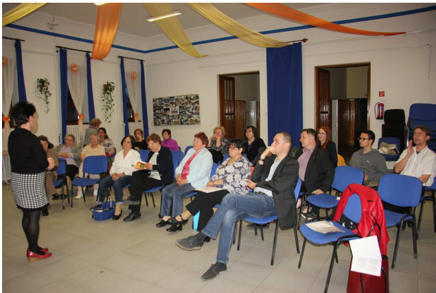
„Vers mindenkinek” a magyar vers napján