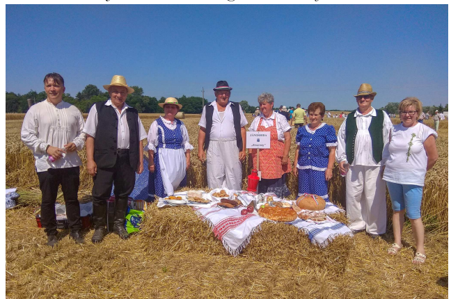
Aratóink a kiskunfélegyházi aratóversenyen