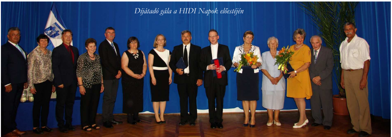
Díjátadó gála a HIDI Napok előestéjén