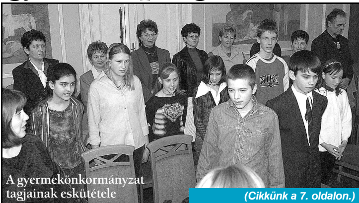
A gyermekönkormányzat tagjainak eskütétele