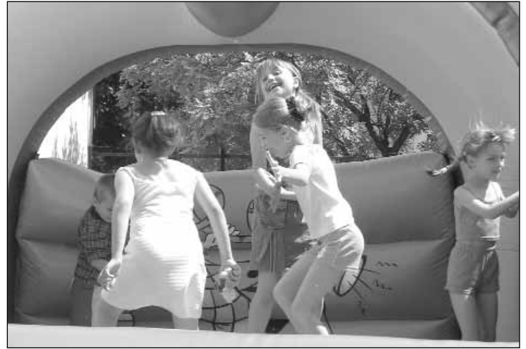
Cikkünk a 9. oldalon.