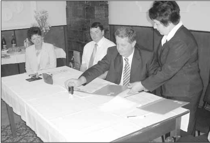
Írásunk a 8. oldalon.