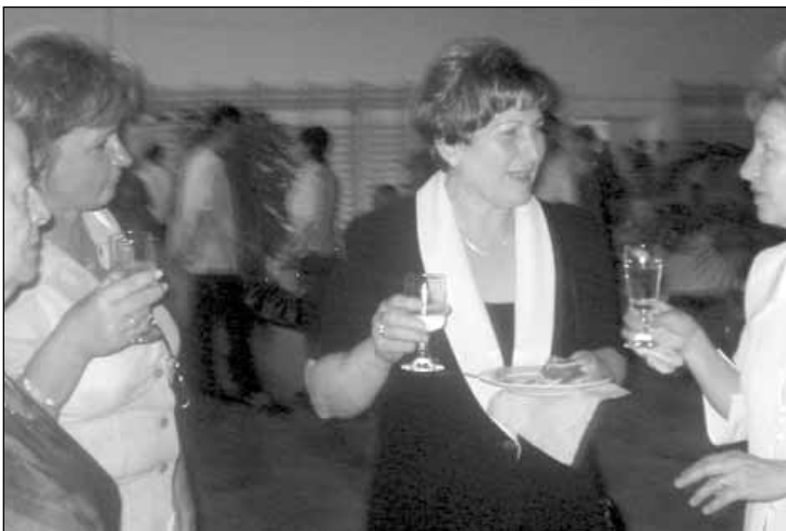
Gratuláló kollégák között