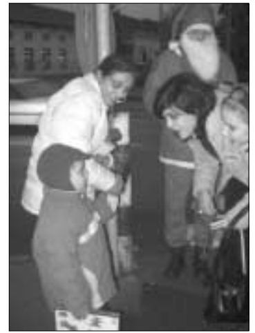
A TÉGY Téliapója vidám krampuszokkal