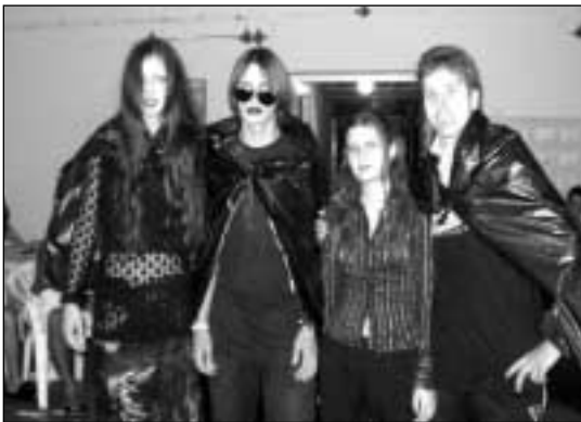
Jelmezverseny - Vámpírok bálja