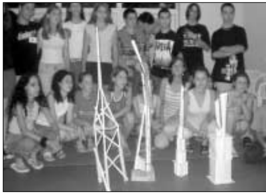
Toronyépítés - csapatonként