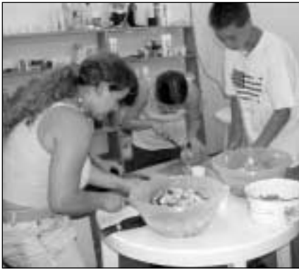
EU-tábor - népek konyhái