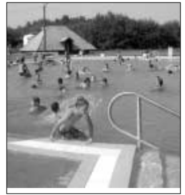
Egy kis fürdés