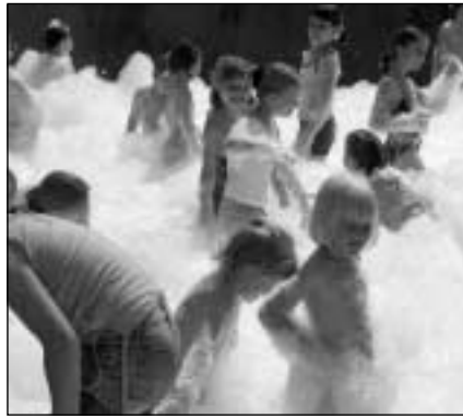
Ez a legjobb - ne habozz