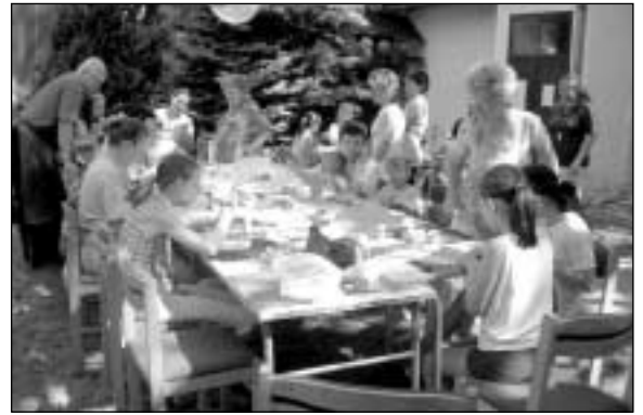
Gyöngy és origami