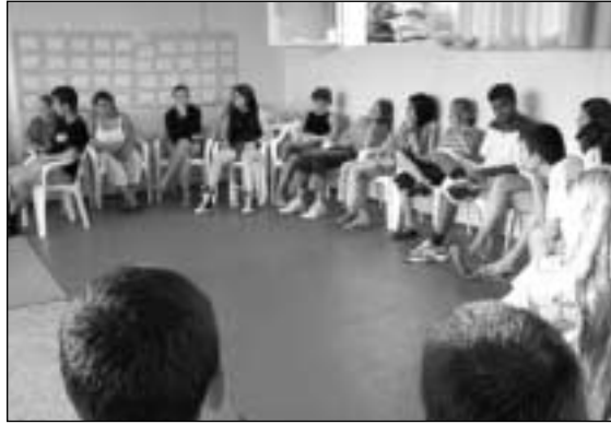
Erópai Uniós képzőtábor Vajtán