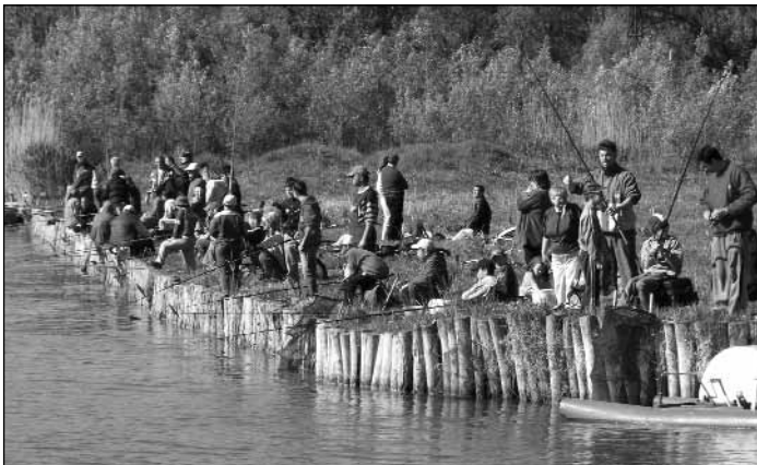
Az egyesület házi horgászversenye