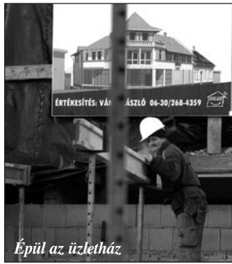
Épül az üzletház

Tervezik az Árpád utca sétálóutcává, és a Hősök tere díszterré váló átépítését is, uniós források bevonásával.