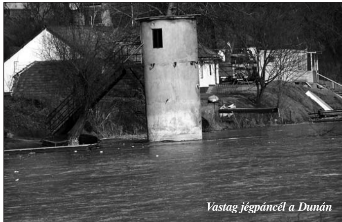
Vastag jégpáncél a Dunán

A horgászok nem alusznak téli álmot, sőt igen aktív időszakot jelent az év vége és az év indulása.