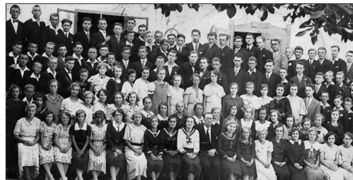
Az 1935-ös koszorúcskán több mint száz tánciskolás vett részt.