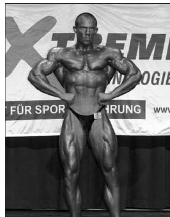
A 2007. évi Ausztria Kupa nyerteseként