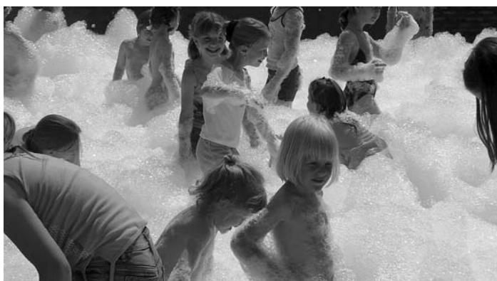
A tavalyi nagy sikerű habparti