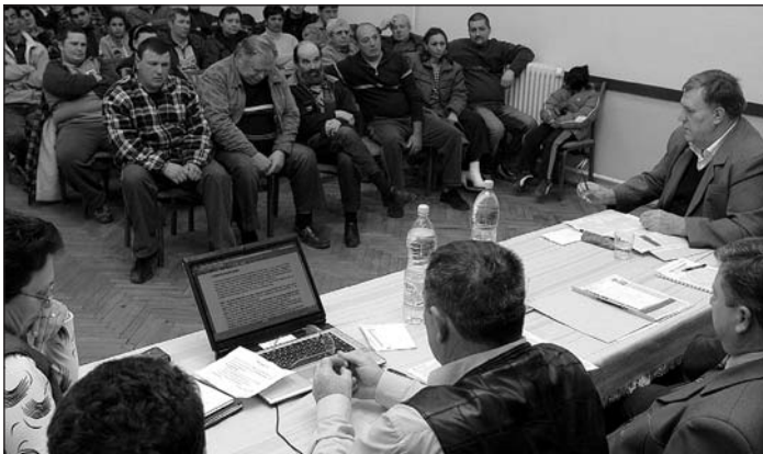
Az elválás előtt falugyűlésen ismertették a lakossággal az érveket, ellenérveket

A március 9-ei népszavazáson az 1779 választásra jogosult mőzsi lakos közül 1013-an jelentek meg az urnák előtt. Az érvényes szavazatok száma 1002 volt. Az elválás mellett voksoltak 685-en, ellene 317-en. Így tehát megnyílt az út Mőzs előtt, hogy Tolnától leválva 2010-től önálló település legyen.