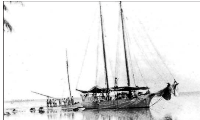
A Tolna nevű kétárbcos

zeum Néprajzi Osztályának (ma Néprajzi Múzeum) adományozott. A mintegy 1600 tárgy mellett a budapesti múzeumnak adományozott üvegnegatívokon 441 eredeti felvételt is, amelyeket ő és felesége készítettek az út során. E fotók gyakran egyedülálló tanúként mutatják be a szigetek lakóinak életét, anyagi kultúráját az adott korszakban. A hosszú, kalandos nászút után felesége elvált tőle, ő pedig visszatért Bécsbe, ahol megírta élményeit. 1908-ban újra megnősült, és újabb feleségével Alice Wertherbevel ismét kalandos nászútra indult a 270 tonnás „Tolna II”-vel. Az út végét ezúttal is válás követte. A gróf 1931-ben, Rómában nősült harmadszor, utóda azonban ebből a házasságból sem született. 1943-ban Párizsban halt meg. Az élmé-