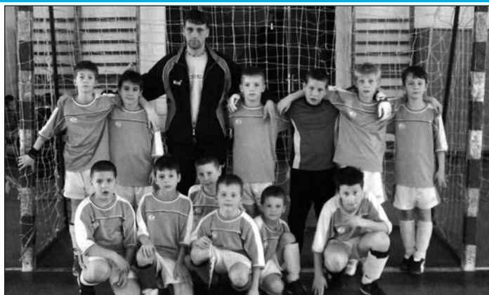
A tolnai gyerekek megérdemelten hozták haza a kupát, amely először került magyar csapatához

IV. Dél-Zselic Kupa néven nemzetközi utánpótlás tornát rendeztek Szigetváron az 1999. január elseje után született, vagyis U9-es fiúknak. A tizenkét csapatos mezőnyben a Tolna VFC ifjúi is helyet kaptak, és ha már részt vettek a tornán, semmi kétséget nem hagytak afelől, hogy a serlegért utaztak a Baranya megyei városba, mintegy negyven szülő kíséretében. A helyi focisuli csapatát 2-0-lal intézték el, de nem járt jobban a PMFC (3-0), és az NK Hask Zagreb (3-0) együttese sem. A döntőbe jutásért az NK Bjelovar korosztályos gárdájával mérkőztek meg a tolnaiak, és Fekete József ta-