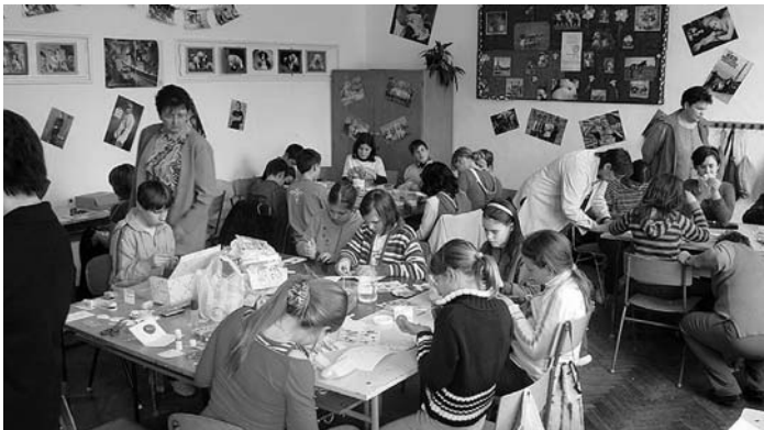
Húsvéti ajándékok, díszek, képeslapok készültek a játszótérben

Március 28-án műsorral, koszorúzással emlékezünk névadónkra, Wosinsky Móra.