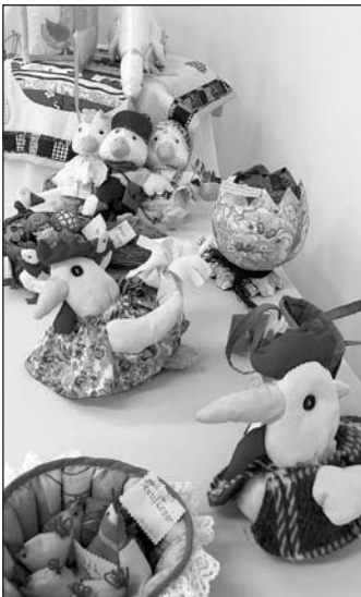
Ezermester kezek remekei

Bebizonyítva, hogy érdemes Tolnán hasonló bemutatkozási lehetőséget teremteni, hiszen rengeteg szebbnél szebb, a szabadidő hasznos és kellemes eltöltését szolgáló, a játékos- és alkotókedvet kielégítő használati és dísz tárgy érkezett az intézmény felhívására. A március 14-ei megnyitón mintegy 70 készítő illetve érdeklődő vett részt,