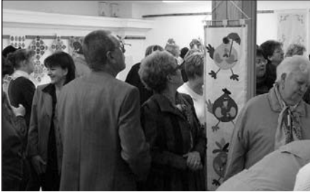
Alkotók és csodálók a kiállítóteremben

Ahány alkotó, annyi ötlet, technika, nyersanyag, és szín jellemzi azokat a tárgyakat, amelyeket a Bezerédj Sport és Szabadidőközpont húsvéti kiállítására és pályázatára készítettek az ügyes kezű versenyzők.