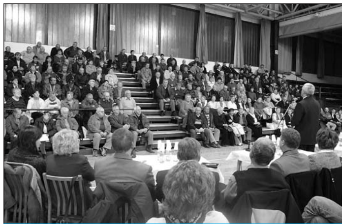
Több mint kétszáz érdeklődő hallgatta a polgármester tájékoztatóját

Dr. Sümegi Zoltán válaszában elmondta: A választékbővítés előnyös a lakosságnak, és a terület ezt a szempontot vette figyelembe. A 99 évre szóló megállapodás a város számára biztosíték arra, hogy ez idő alatt a beruházó nem változtathat a feltételeken, nem szabhat meg bérleti díjat a jelenlegi ingyenesség helyett stb. A képviselők ezért szavaztak a beruházás mellett, döntésük hátterében semmilyen anyagi érdekelttség nincsen.