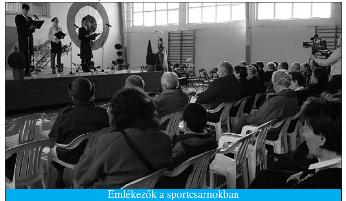
Emlékezők a sportszarnokban