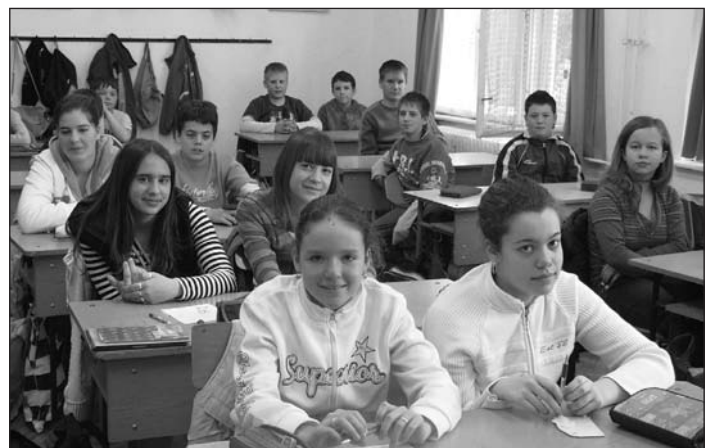
A 6.b osztályosok már a felújított iskolában ballaghatnak