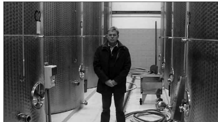
Hol van már a fahordó?