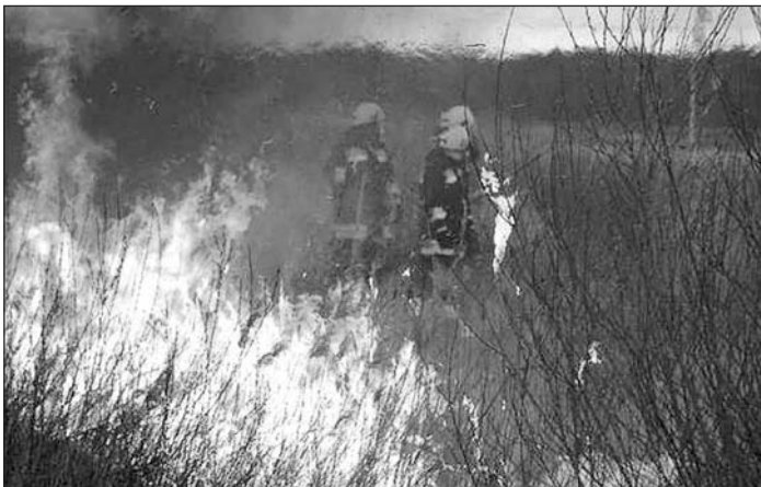
Az avartüzek hatalmas pusztítást végezhetnek