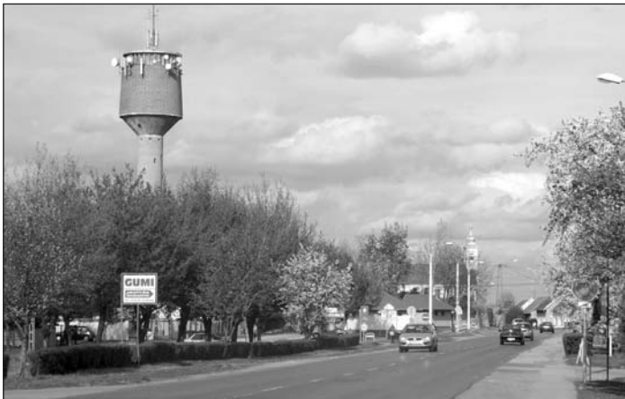
A torony a város jelképe ma már