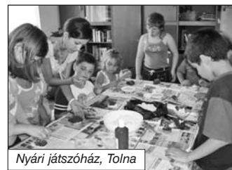
Nyári játszóház, Tolna