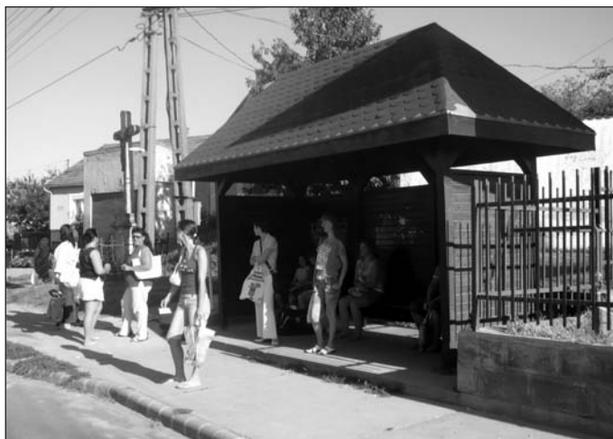
Új buszmegálló a vásártérnél

– Én ezt nagyon fontosnak tartom. A tolnaiak mindig is büszkék voltak a városukra, és ezt még erősíteni szeretnénk. Ezért folytatjuk a helytörténeti anyagok gyűjtését is, amelyből már megnyílt egy kiállítás a városházán. Több új tablót, régi dokumentumot is kihelyeztünk, majd, a gyülekező tárgyi emlékek pedig reményeink szerint egy leendő helytörténeti múzeum alapját képezhetik. Úgy vélem, hogy ezek is a városunkhoz való ragaszkodásunkat, lokálpatriotizmusunkat erősíthetik. És akik szeretni tudják a helyet, ahol élnek, büszkék a múltjára, azok itt képzelik el a jövőjüket, és tenni is fognak a városért. Ez pedig közös érdekünk. csi