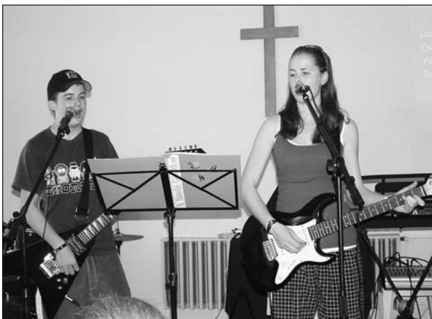
Istent dicsőítő énekek kísérik az istentiszteleteket

Az EBE már minden lakott földrészen jelen van. Bibliái alapokra építkeznek, de – ahogy a gyülekezetvezetők fogalmazznak – másképp végzik a lélekmentést, mint a többi egyház.