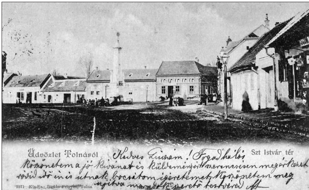
A balatonfüredi 1899. szeptember 16-i postabélyegző tanúsítja, hogy a Szt. István tér épületei és a Szent-háromság-szobor már 99 éve a helyén van. A képeslap kiadója Isgum Frigyes könyv és papírkereskedő (a kép jobboldalán van az üzlete), készítője Weltmann Ignác nyomdász.