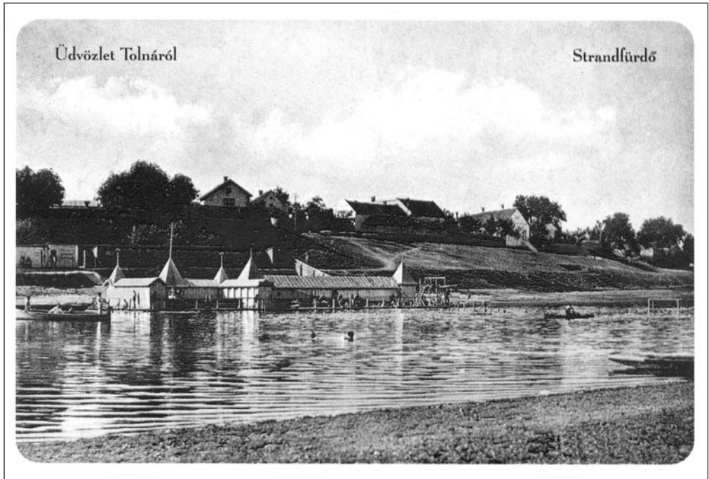
Az egykori strandfürdő képe a fürdőházakkal