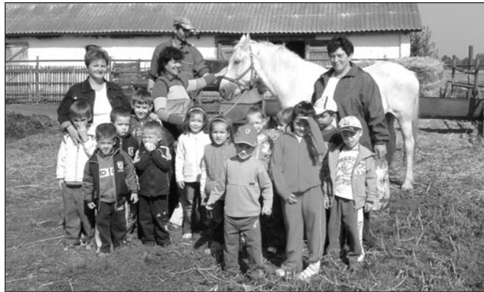
Állatok közt, természetes környezetben