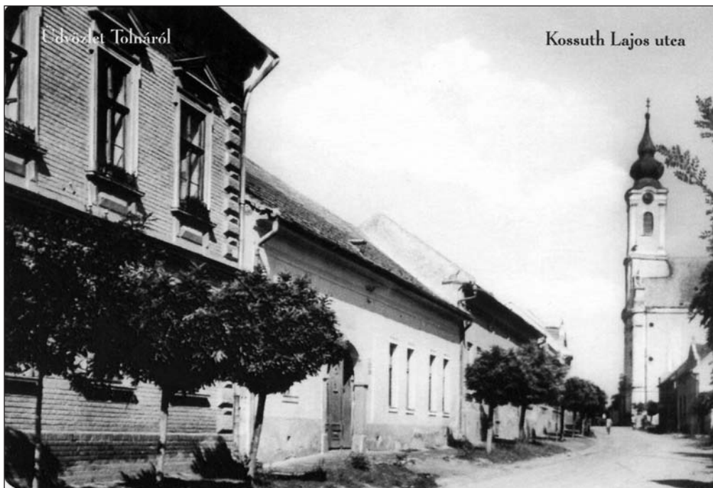
A korabeli felvételen a Kossuth Lajos utcát láthatjuk.