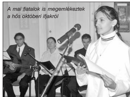
A mai fiatalok is megemlékeztek a hős októberi ifjakról