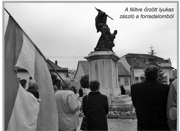
A féltve őrzött lyukas zászló a forradalomból

járt e helyzetben a történelmi párhuzammal élve, hozzátéve, hogy maga 1956 is hasonló üzenetet hordoz, amennyiben valóban egy maroknyinak számító, lelkes csapat állította meg akkor meghökentető módon a 200 ezer katonával és 3000 tankkal érkező, ropant, szovjet hadsereget. Mert ez '56 lényege.