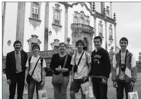
Viseu temploma előtt a tolnai csapat

Csütörtök délelőtt a Sangemil gyógyfürdőt mutatták meg nekünk. Az utolsó napi ebédet a mi kedvünk szerint állították össze: disznóhúst kaptunk krumplival. Délután Viseu-be mentünk. Ott is igyekeztek megmutatni mindent, ami számunkra érdekes lehet, a katedrális, a templomot és a történelmi nevezetességeket. Sétáltunk a keskeny utcákon és fényképeket készítettünk. Elmaradhatatlan program volt még a Palácio do Gelo bevásárló-