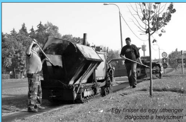
Egy finiser és egy úthenger dolgozott a helyszínen