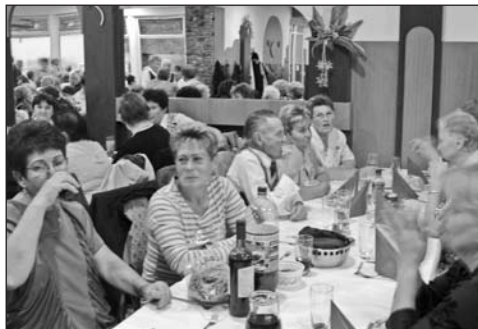
Megtelt az étterem a nosztalgiaórákkal

Mert ez lengte körül azt a deresedő hajú csapatot, akik, mintegy 150-en, immár ötödik alkalommal, most is eljöttek ide, visszapillantani pár órára a múltba, hogy a jótékonyan rostáló emberi emlékezet eredményeképpen csak arra emlékezzenek, ami szép volt. Mert volt az is. Hiszen az utálatos mesterre, az állandóan növekvő normákra, a karikás szemű, ólomlába-kon járó éjszakai műszakokra ugyan ki emlékszik már? Sokkal inkább megmaradt az első fizetésből vásárolt bicikli, az itt fellángolt nagy szerelem emléke, és az éjszakai műszakból is az,