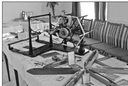
Az egykori munkaeszközök múzeumi darabbá lettek