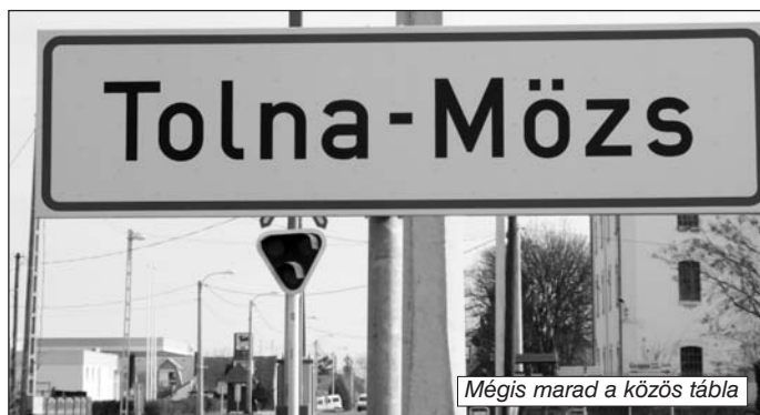
Mégis marad a közös tábla