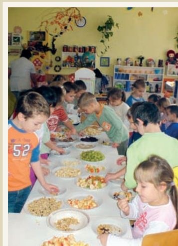
Chips helyett müzli és gyümölcssaláta

November 28-án pénteken mozgásos játékos vetélkedő zárta a sorozatot, amelyben voltak sorversenyek, almaszedő verseny, tálcán narancshordás egyensúlyozással, lufifújás, méznyalás és egyéb ügyességi és erőnléti játékok. A gyermekek nagyon élvezték az erőpróbákat, amelyek végén a résztvevő csapatok „arany alma, piros alma, és zöld alma” oklevelet vehettek át.