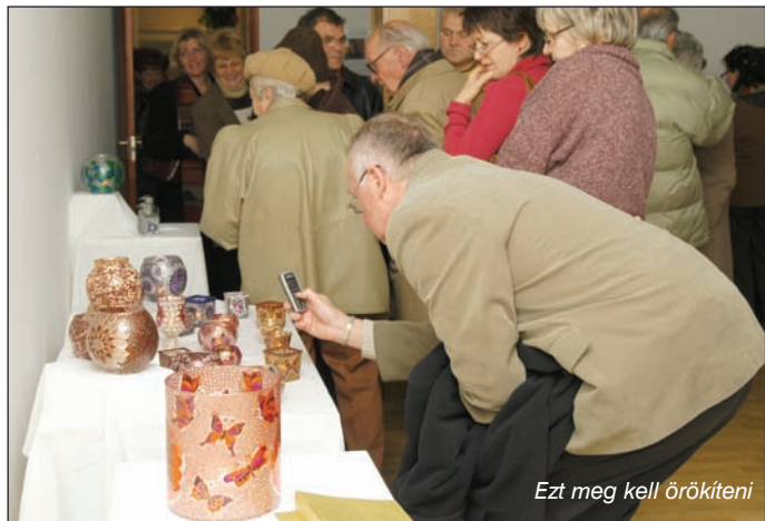
Ezt meg kell örökíteni