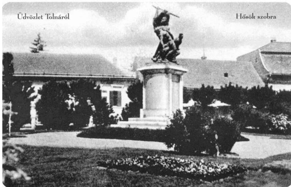
A korabeli felvételen a Hősök szobrát látjuk – még az emlékművet védő kis kerítés nélkül.