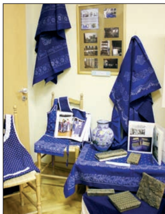
Habán és kékfestő közös kiállítás