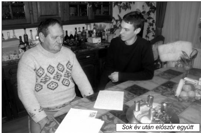
Sok év után először együtt

De most rajtam van a szemüveg! És minderre a sok rosszra alig emlékszem már. És még mindig ülve az ágy szélén, életre kelnek az