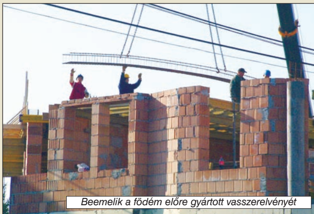
Beemelik a földem előre gyártott vasszerelvényét