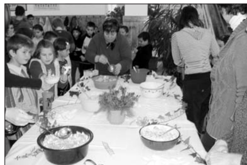
Salátákat is készítettünk

November 20-án „aktív egészségdélutánt” szerveztünk. Nyolc helyszínen játszhattak, tanulhattak, tevékenykedhettek gyermekeink. Le-