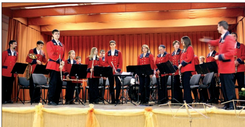
A Fusz János Zeneiskola Fúvószenekara