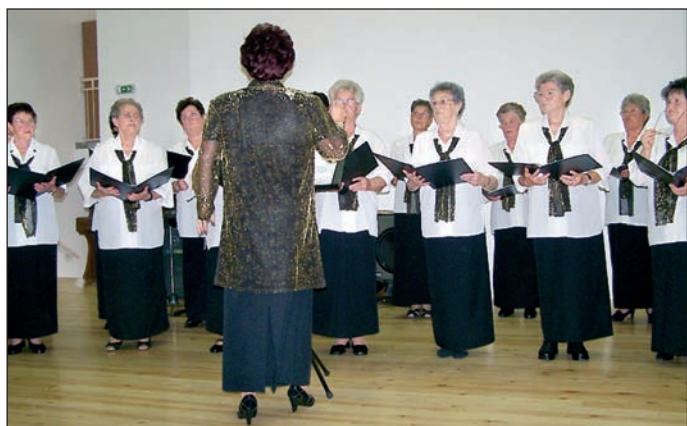
A tolnai nyugdíjas klub kórusa Kozármislenyben

2009. tavaszán Kozármisleny látogat Tolnára, amikor a két település kulturális csoportjai kapnak fő szerepet a programokban.