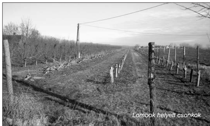
Lombok helyett csonkok

– 400 hektár volt a tolnai téesz-kertészet – tudom meg tőle – 50 ezer négyzetméter fűthető fólia felülettel. 15 hektár volt a síkfólia, 40 hektár az étkezési paprika, 20 hektár a fűszer, ugyanannyi a konzervparadicsom, 10 hektár káposztaféle, 100 hektár a zöldbab. Telepítésekor 100 holdas volt az almagyümölcsös és 100 hold a téesz-szőlő. Munkát és kenyeret adunk 5-700 embernek szezonban, és biztos megélhetést