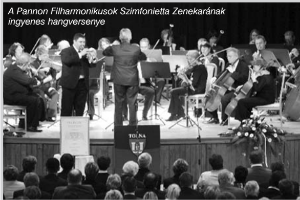
A Pannon Filharmonikusok Szimfonietta Zenekarának ingyenes hangversenye