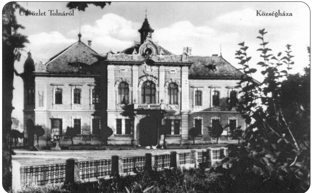
A mai Városháza a Községháza feliratú képeslap kiadásakor éppen a Tanácsháza nevet viselte.