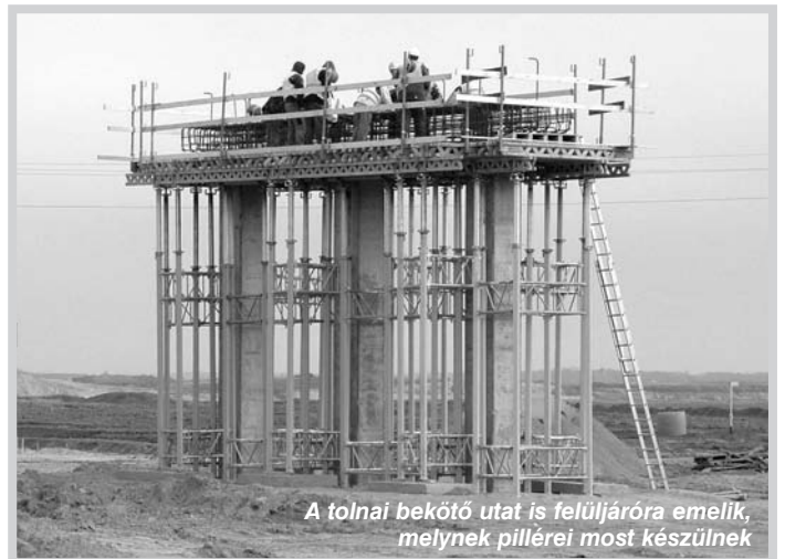
A tolnai bekötő utat is felüljáróra emelik, melynek pillérei most készülnek