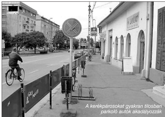
A kerékpárosokat gyakran tilosban parkoló autók akadályozzák

taik szerint a válaszdók ?-ét zavarja, vagy nagyon zavarja a forgalmi eredetű zaj, és ennél is nagyobb mértékben (84%-ban) a forgalmi zsúfoltság. A forgalom zavaró hatása elsősorban a várost ÉK-DNY-i irányban átszelő 5112. számú összekötő út átkelési szakaszán (Ady-Alkotmány-Deák F.-Szekszár-