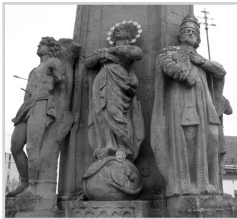
Képünkön a szent jobbról, sisakban, kezében könyvvel látható