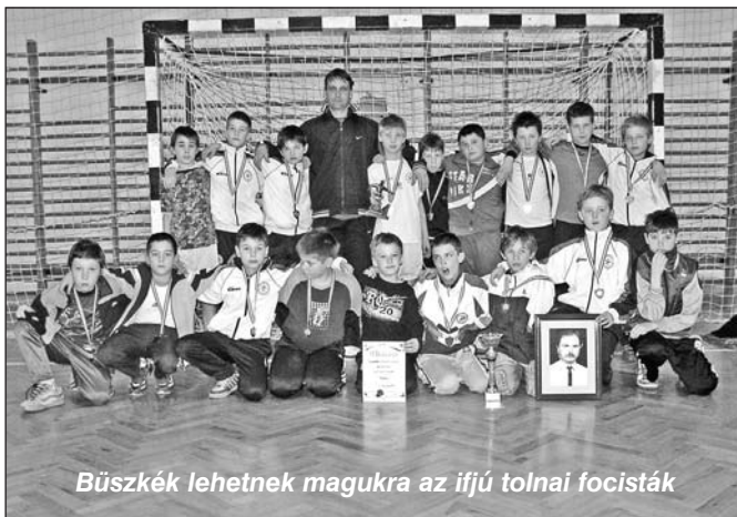
Büszkék lehetnek magukra az ifjú tolnai focisták