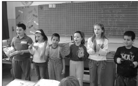
A hatodikosok a Toldival vitézkedtek