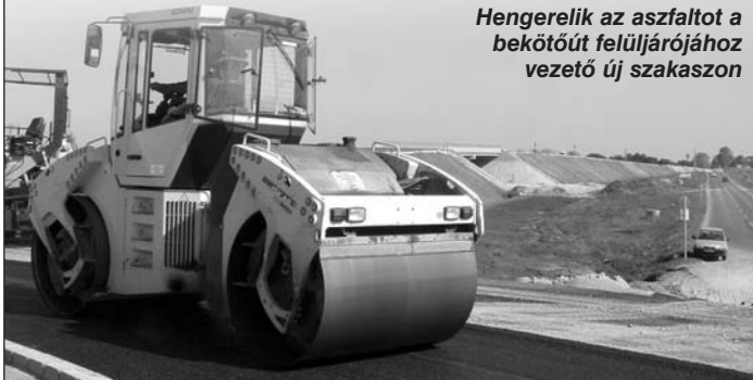
Hengerelik az aszfaltot a bekötőút felüljárójához vezető új szakaszon