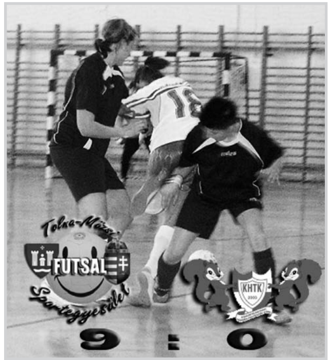
Tolna-Mözs NFSE-Kiskunfélegyháza: 9-0

Gól: Klézli (1), Simon (2), Mausz (1), Hodován (2), Folk (1), Baki (1), Varga (1).