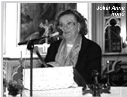
Jókai Anna író nő

szettől, a teremtett világtól. Így jutottunk el a környezetvédelem kérdéséről, a bibliai magvetőről szóló példabeszéd tanulságaihoz, mely szerint az ember esendősége – akár csak a rossz helyre hullott magé – nagyban függ a sors által ránk mért, de még inkább, a magunk által választott környezettől. A szentmise áhítatát nagyban emelte a faddi templomi kórus nívós szereplése,