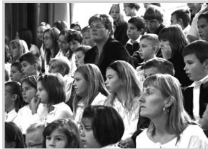
Egy kicsit megállunk, ünnepeltünk, de az idő rohan tovább...

Tóth Árpád szavaival élve: „Még sok-sok ötven évet...”