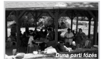
Duna parti főzés

Szolgáltatások: hétköznapokon, hétfőtől péntekig, 8 órától 16 óráig: – napi háromszori étkezés, igény szerint – hetente orvosi ellátás – lelki segítségnyújtás (egyéni és csoportos beszélgetések, szakember segítségével) – rendszeres vérnyomás, vércukor, testsúlymérés – fodrász, pedikűr, manikűr, megbeszélés alapján – érdekképviselő, ügyintézés