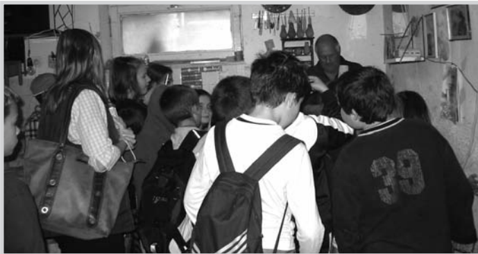
A Wosinsky Mór Általános Iskola 3.a és 4.a osztályának német nemzetiségi nyelvét tanuló diákjai