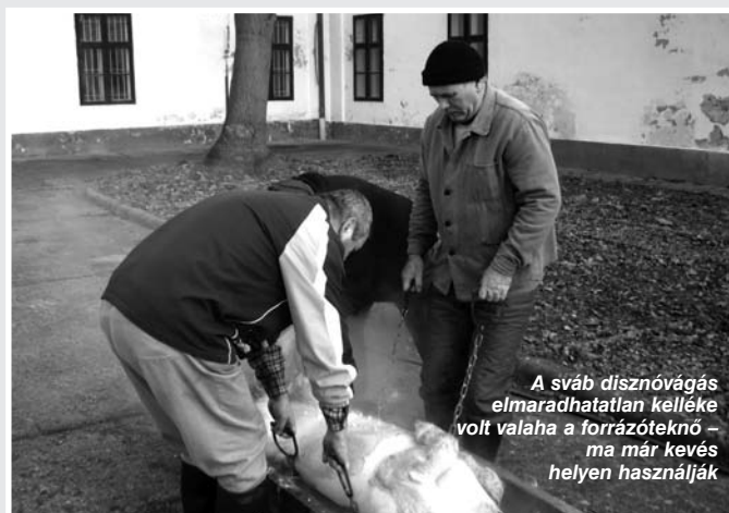
A sváb disznóvágás elmaradhatatlan kelleke volt valaha a forrázóteknő – ma már kevés helyen használják

viszarávedni, gondolhatták a helyi német kisebbség vezetői, amikor az idén is úgy szervezték meg hagyományörző disznóvágásukat, hogy ez mindenképp domborodjék ki belőle.