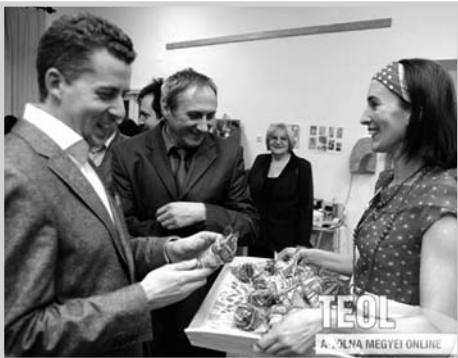
Rákay Philipet Kurz Evelin kínálja téli fagyival