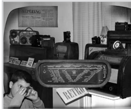
Régi tárgyak – új generáció