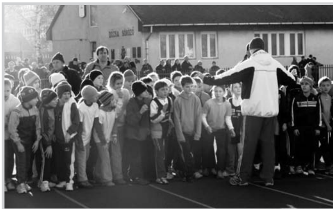
A győri Heraklész Fizikai Felmérő Bajnokságon elért kiváló eredmények tükrében, derülátóan várják az évad elkövetkező versenyeit. A képen az országos mezőnyben, a 2001-ben születettek futása látható, köztük a tolnai utánpótlás apró tagjai

sportolója három edző irányításával célozza meg a legjobb fizikai és technikai szint elérését. Ez már csak azért is fontos, hiszen április 23-án, már a szegedi Hanzók Őrs