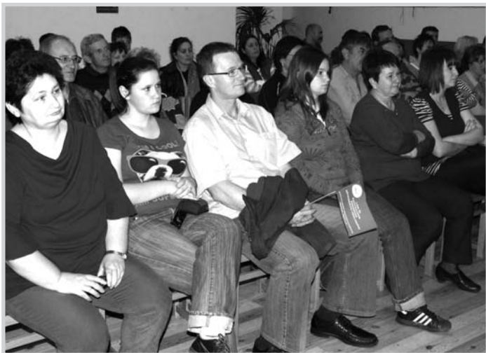
A hallgatóság feszült figyelemmel hallgatta az érdekesítő beszámolókat

dennapokban a nehézségek leküzdéséhez. A családnak úgy kell működnie, hogy minden tagja biztonságban érezze magát. Ahol