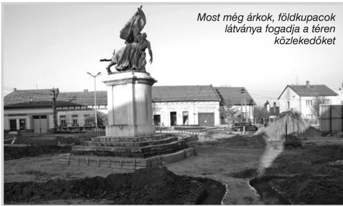
Most még árkok, földkupacok látványa fogadja a téren közlekedőket