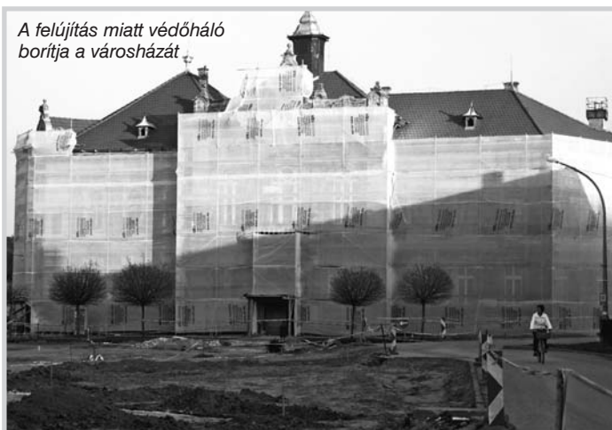
A felújítás miatt védőháló borítja a városházát