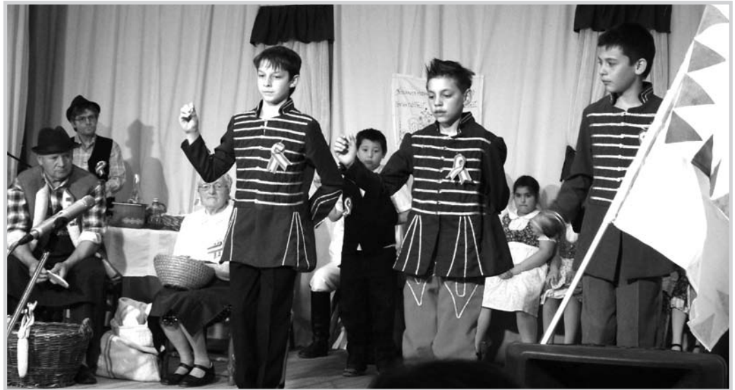
Mözsön gyerekek és felnőttek közös színdarabban idézték fel a forradalmi eseményeket

Az ünnepség – ahogy sok éve már –, az idén is a Lehel utcai sportcsarnokban kezdődött Széchenyi iskolások műsorával. És itt mindjárt meg is kell állnunk egy pillanatra. Az elmúlt években ugyanis volt már rá példa, hogy az ünnep emelkedettsége érdekében hivatásos előadóművészeket, illetve együtteseket szerződtettek ezen ünnepi alkalmakra. Akiknek produkcióival – szögezzük le –, mindenki meg is volt elégedve. Ám hogy mi a különbség egy lelkes gyermekserg, és a profi előadóművészek produkciója között, azt itt és most érezhette meg a közönség. Mert bizony van! És itt a legtöbbünk a maga gyermekkorára gondolhatott, amikor izgalomtól