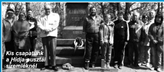
Kis csapatunk a Hídja-pusztai síremléknél

Immár 3. alkalommal szervezzük meg a Bezerédj Pál Kerékpáros Emléktúrát a Bezerédj Napokhoz kapcsolódóan.