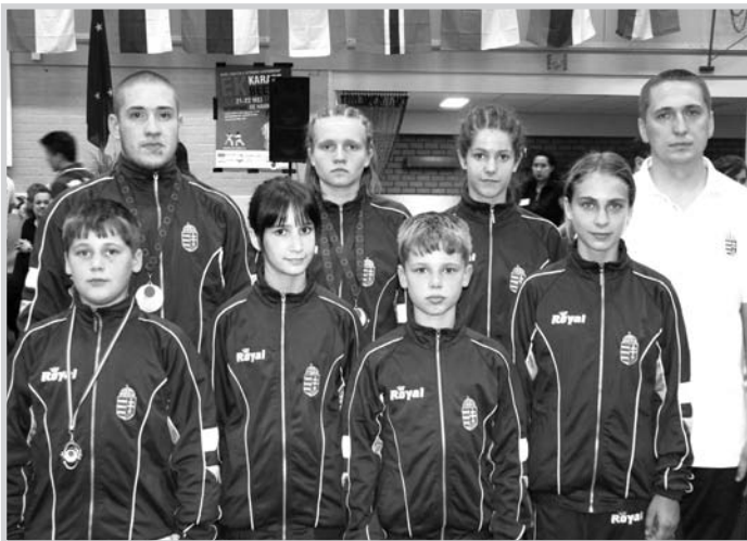
A korosztályos Európa-bajnokságon

Külön köszönetet szeretnénk mondani a kiutazó szülőknek buzdításukért, lelkes szurkolásukért, mellyel nagymértékben hozzájárultak a versenyzők teljesítményéhez és a magyar csapat összetartozásának erősítéséhez. A versenyre az MVM Atomerőmű támogatásával jutottak el versenyzőink!