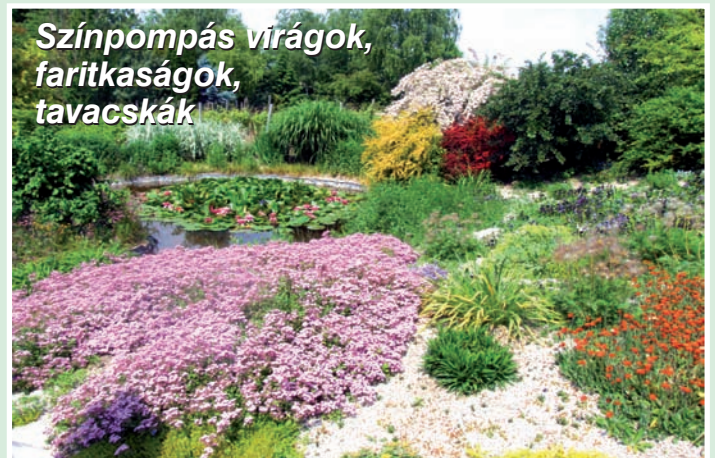
Színpompás virágok, faritkaságok, tavacsák

Kertről-kertre haladva tavacsákban virágzó fehér, rózsaszín és sárga tavirózsák köszöntenek bennünket. Pár lépéssel odébb a sziklakerti szegfűk bódító illata és finom színei várják dicséretünket. Amerre a szem ellát, mindennél gondosan ápolat ágyások, nyírt gyepek köszönti a látogató-