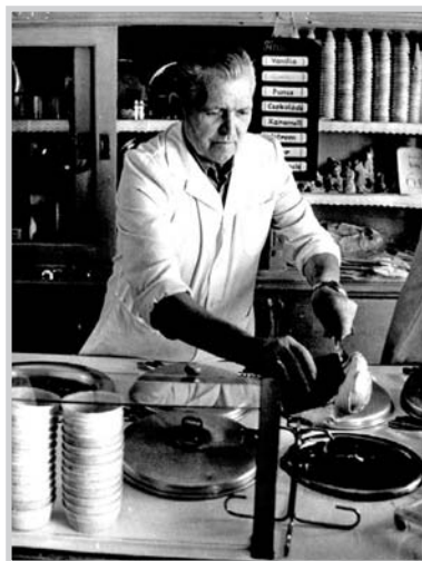
„Csucus” anno, fagyimérés közben

Egy települést csak részben lehet leírni a rá jellemző számszerű adatokkal. Fekvése, utcáinak, gyárainak és lakosságának száma, bár fontos jellemzők, valójában semmit sem mondanak el igazi mivoltáról, egy ugyanolyan paraméterekkel bíró másik város mellé állítva. A különbség az emberi tényező: a nemzetiség, a kultúra, az erkölcs, a tudás, szorgalom, becsület, az emberi helyállás minősége. Így fordulhat elő, hogy akárcsak egy mesterség kiváló képviselői is maradó nyomot tudnak hagyni egy városon. Hogy mindez így van, arra a legékeesebb bizonyíték az, hogy a két éve elhunyt Werling József cukrászmester életművéről a város napján hivatalosan is kijelentették mindezt, azok sorába iktatva őt, akik nélkül egész biztosan más lett volna a XX. század Tolnájának arculata.