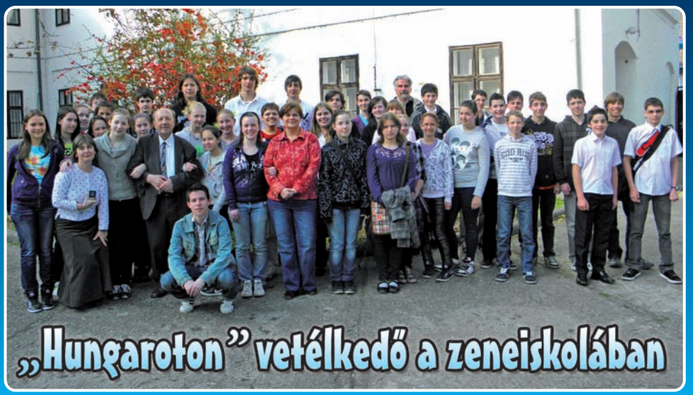
„Hungaroton” vetélkedő a zeneiskolában