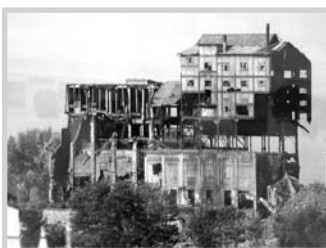
Egy régi gyárpépület maradványai