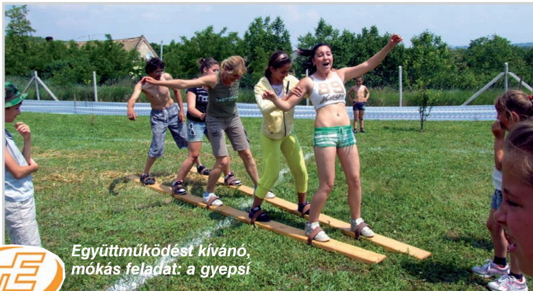
Együttműködést kívánó, mókás feladat: a gyepesi

Sorszámok húzása után mindenki elfoglalta helyét és megkezdődött a pavilonépítő „örület”, majd indulhatott a pörköltfőző verseny. Aki nem kötött kötenyt, az részt vehetett a mókás sorversenyeken. Öltöztető váltó volt az első szám (na itt sikerült olyan kreációkat felvonultatni,