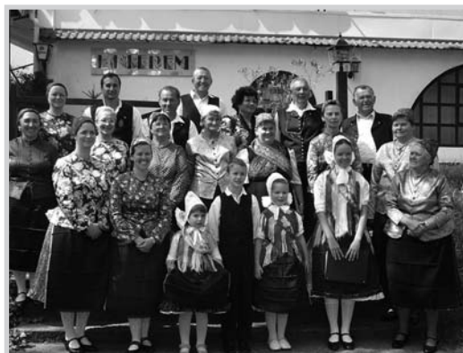
A Mőzsi Német Nemzetiségi Kórus