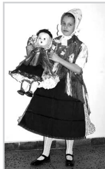
Kislány mőzsi viseletben

Az énekkarral a Magyar Rádió Pécsi Körzeti és Nemzetiségi Szerkesztősége 1999-ben rádiófelvételt készített. Rendszeres szereplői a városi rendezvényeknek. Az eltelt évek alatt fellépéseikkel a megye számtalan településének kulturális életét színesítették. Szinte az egész országot bejárták Kőszegtől Villányig, Pécestől Gárdonyig. A kórus fellépéseinek színvonalát a dalok előadásán túl a mőzsi viselet bemutatásával is emeli. A rendszeres próbák eredményeként 2007-ben ezüst, majd 2010-ben dicséretes ezüst minősítést ért el.