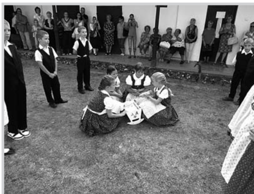
A gyerek táncsoport

Az elmúlt húsz esztendő nem mindig volt felhőtlen a klub életében. Viták, súrlódások néha előfordultak. Mivel működésüket tagdíjból és különböző pályázati pénzekből finanszírozzák, legnagyobb