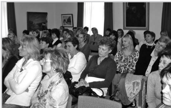
A szakmai nap résztvevői

TOLNA VÁROS ÖNKORMÁNYZATÁNAK CSALÁDSEGÍTŐ KÖZPONTJA, 7130 Tolna Bajcsy-Zs. u. 96. Telefon: 74/443-825, 74/540-711