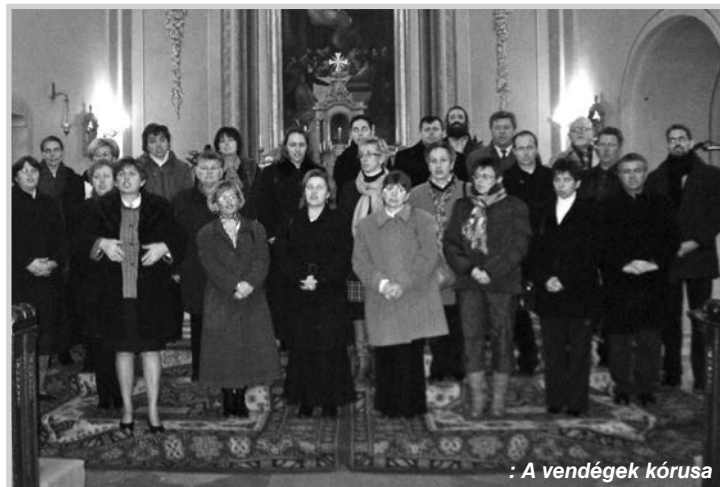
: A vendégek kórusa