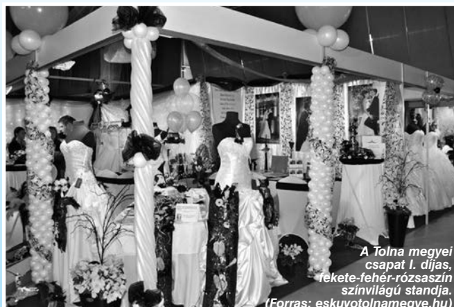
A Tolna megyei csapat I. díjas, fekete-fehér-roszszalín színvilágú standja.