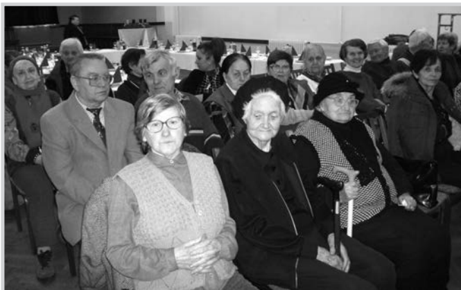
Az idősek klubja karácsonyi ünnepségén

Köszönjük a lakosság részéről eddig tett felajánlásokat.