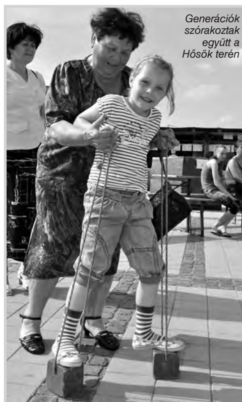
Generációk szórakoztak együtt a Hősök terén

A kitüntetettek méltatását külön cikkünkben olvashatják.