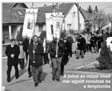
A tolnai és mőzsi hívek már együtt vonulnak be a templomba

templomi zászlók alatt, minden bizonnyal jelentős sokadalommá dagadva vonult a szekszárdi országtúttal párhuzamos, egykori Cigliperg (ma Babits utca) szőlői közt Mőzs irányába. Hogy hová és meddig? Erre sokáig kerestük a választ, mígnem