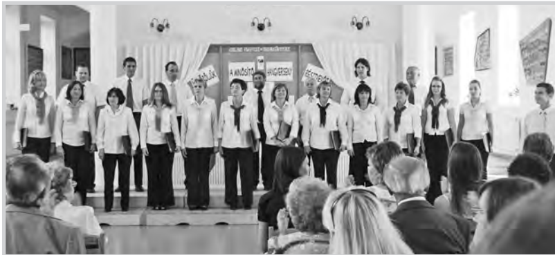
Az Ad Libitum Kamarakórus arany minősítést kapott