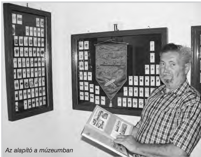
Az alapító a múzeumban

Az Első Magyar Jelvénytármúzeum 2010 májusától fogad vendégeket. Az alapító jelvénygyűjtő találkozókat is szervez minden évben