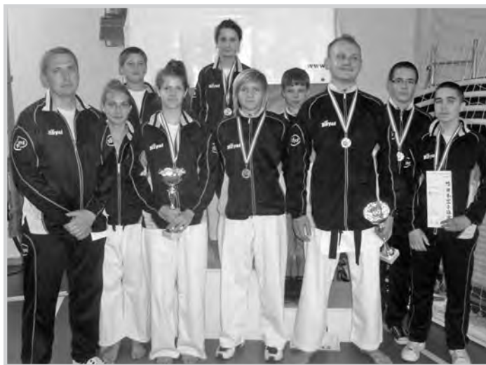
A csapat az országos bajnokságon

A versenyt követő hétvégén még egy válogatott edzésen vettek részt