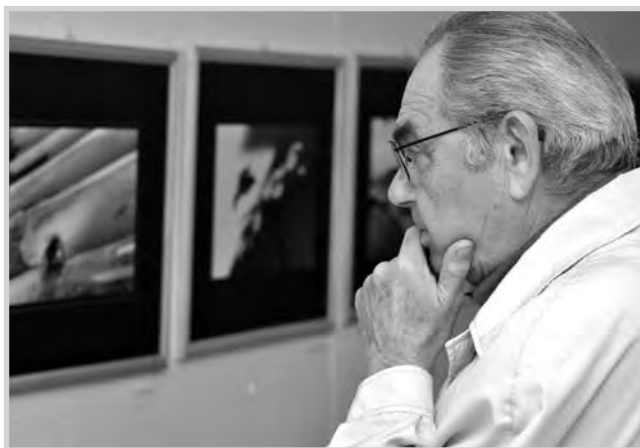
Fotó: Ill. Németh István

Az alkotásokat májusban már láthatta a tolnai Aközönség a Wosinsky Mór Általános Iskolában, július 18-tól pedig Faddon lesznek megtekinthetők a Volent öbölben. Részletek a plakáton.