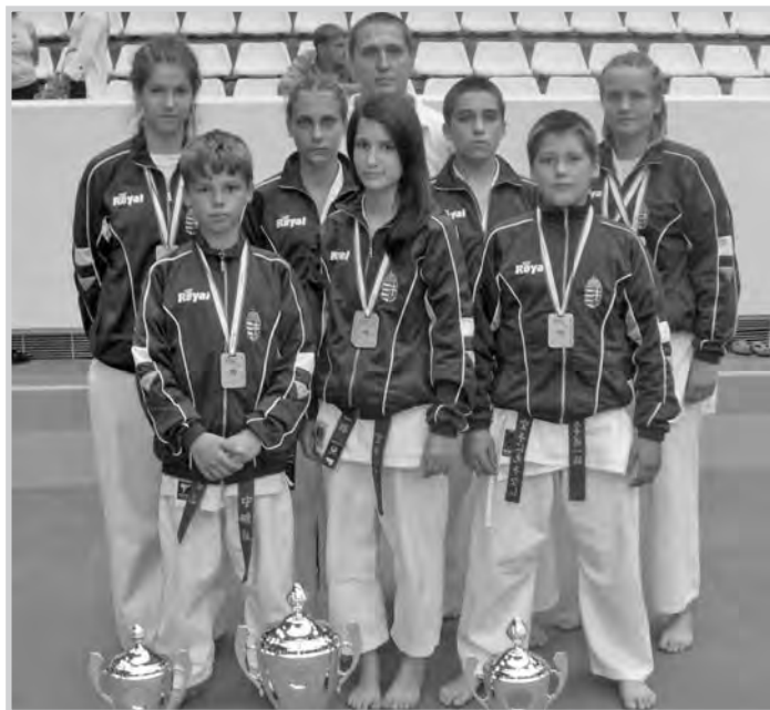
A maximumot hozták ki magukból Párizsban

Továbbá köszönet illeti a Faddi Sportegyesületet, mely anyagilag hozzájárult versenyzőink költségeinek faragásához.