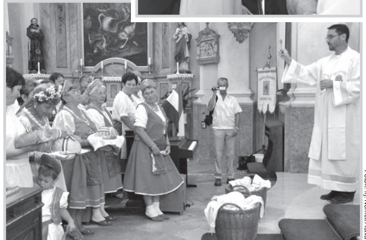
Fotók: ill. Németh István