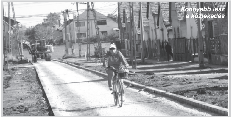
Könnyebb lesz a közlekedés

– 2009-ben indult a pályázat az Integrált Városfejlesztési Stratégia elkészítésével. 2010-ben nyújtottuk be a pályázatot a Dél-Dunántúli Regionális Fejlesztési Tanácshoz. A pályázati struktúra átalakításával (az iskolaépületére tervezett fejlesztések kimaradtak) 2011 őszén került sor a támogatási szerződés megkötésére. A kivitelező kiválasztási eljárások 2012 elején indultak meg és július-augusztusban záródtak. A kivitelezési munkák várható befejezése: 2012. november 30. A pályázat zárása: 2012. május 31-re várható. A projekt összes költsége: 270.359.013 Ft. Támogatási intenzitás: 84,99 %. Támogatási összeg: 229.805.153 Ft, ebből önerő: 40.553.860 Ft. Cs.I.