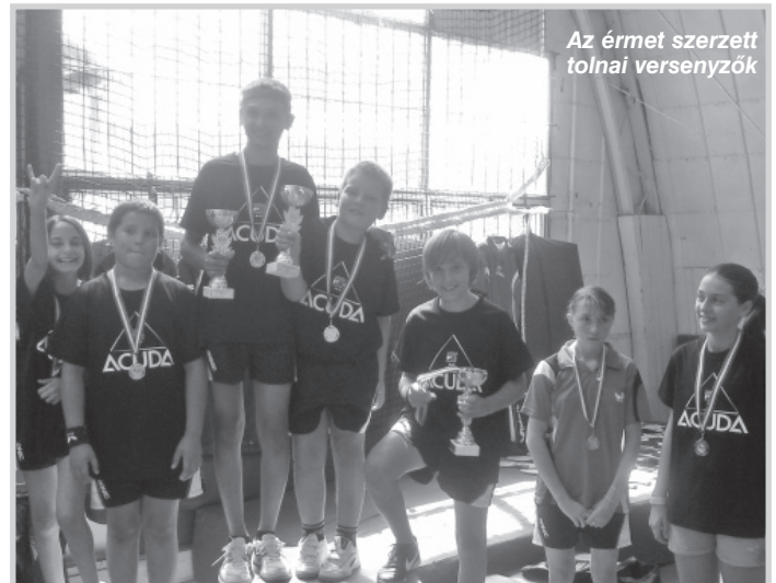
Az érmet szerzett tolnai versenyzők

A Bolgár testvérek pedig a párosok versenyében érdemelték ki ezüstérmét. Zsolnai Beatrix a 12-13 évesek mezőnyében 3. lett.