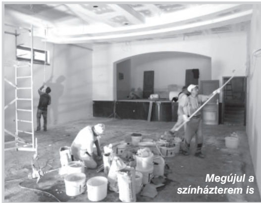
Megújul a színházterem is

– A pályázati kiírás alapfeltétele volt, hogy a projekt olyan területen valósuljon meg, amit a KSH szegregátumként jelöl, azaz környezetében társadalmilag, gazdaságilag, infrastruktúrájában elma-