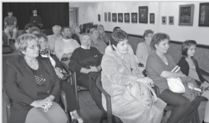
A gyönyörű alkotások sok érdeklődőt vonzottak a megnyitóra

A szárnyaló képzelet, a magas fokú technikai tudás, a különleges világlátás, a kézzel fogható tárgyakba öntött mély, filozófiai gondolatok megtestesülését láthatja a kiállításon, amely szeptember 28-án nyílt meg Kaláris címmel a Tolnai Galériában.