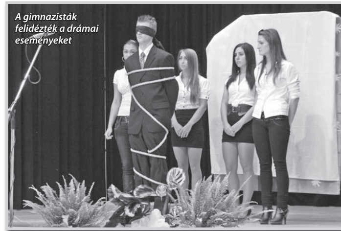
A gimnazisták felidéztek a drámai eseményeket

elhangzásakor karácsonyfa szolgált díszletként, melyet aztán darabokra tépve előbukkant fenyegető valóságként egy akasztófa, rajta kötél