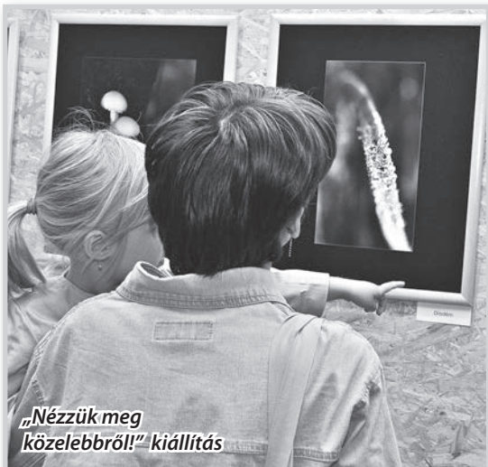
„Nézzük meg közelebbről!” kiállítás