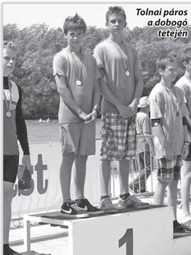
Tolnai páros a dobogó tetején