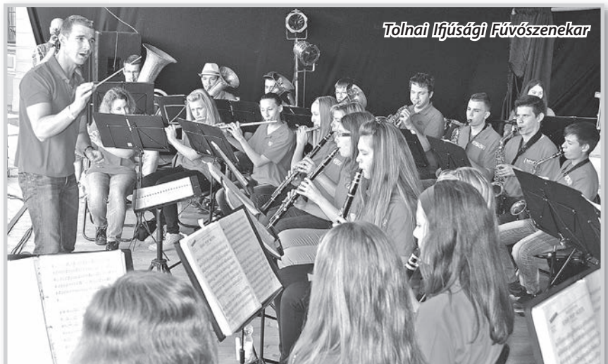
Tolnai Ifjúsági Fúvószenekar