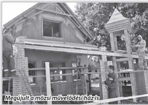
Megújult a mőzsi művelődési ház is

nehéz helyzetét, lehetővé tette, hogy a kistelepülések – legfeljebb ötmillió forint beruházási összegig – 95 százalékos támogatást kapjanak. A módosítás sok igényt generált, a pályázatok közül tíz tartozott ebbe a kategóriába.