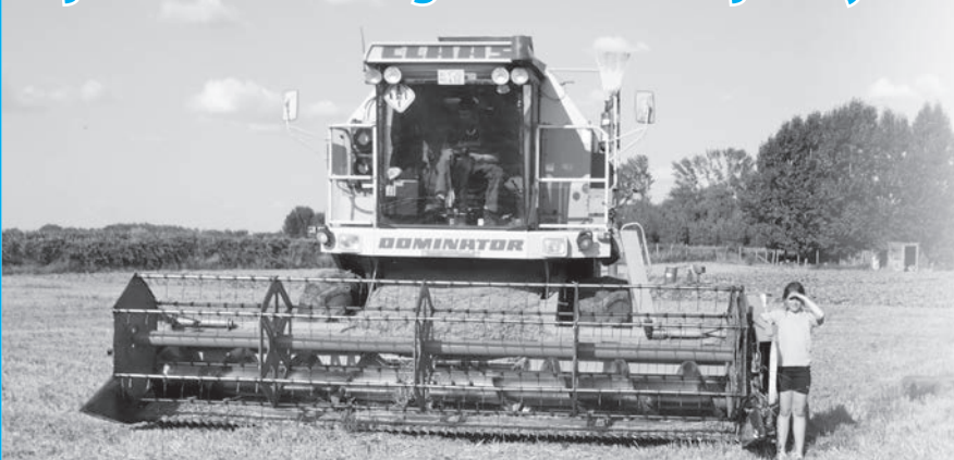
Szélsőségek éve az idei mezőgazdasági év

Az idén két hetet csúszott, de aztán végül is minden hátráltató tényező nélkül zajlott le a mezőgazdasági év legjelentősebb kampánymunkája, az aratás.