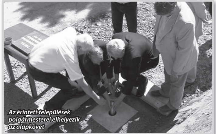
Az érintett települések polgármesterei elhelyezik az alapkövet

A tolnai agglomerációhoz tartozó – 1972-ben épült – szennyvíztisztító telep jelenlegi formájában alkalmatlan az előírt tisztítási paraméterek teljesítésére, a növekvő