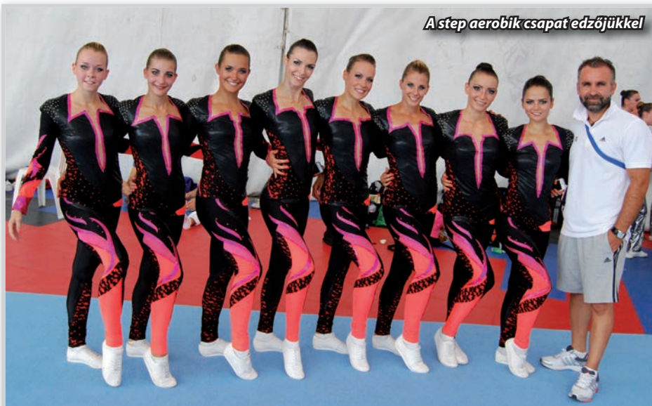
A step aerobik csapat edzőjükkkel

verseny-aerobikhoz erőnléte, hajlékonysága évek óta szerzett egyéb tapasztalata jó kiindulópont volt. Az egyetemi évek alatt a magyar step aerobik csapat tagjaként a 2009-es Európa Bajnokságon 4. helyezést értek el. Részt vettek 2011-ben a Kínában rendezett Universiadén. Ezután következett a 2012-es szófiai VB, ahol 13 csapat közül a 7. helyezést érte el a nyolcfős, lányokból álló magyar csapat. Ez a verseny egyben az idei évben megrendezésre kerülő nem olimpiai sportágak olimpiájának kvalifikációja is volt. A lányok 7. helyezése kevésnek bizonyult, hiszen az első 6 csapat utazhatott Columbiába Caliba, ahol 2013. augusztus elején került megrendezésre a világtájkok. Hatalmas csalódás volt a csapatnak ez az eredmény, pedig gondoljunk bele a világ 7. legjobbjai voltak. Ekkor többen be is fejezték a versenyszerű spor-