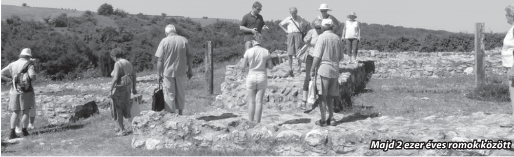
Majd 2 ezer éves romok között

Első állomásunk a Paksi Atomerőmű Látogatóközpontja volt. A terem végigjárása egy időutazással ért fel. A villamosítás kezdetei. Az első kapavágás, az építkezés folyamata képekben, majd az erőmű elindítása, és az erőműben, napjainkban folyó munka. Az atomenergia előállításának folyamata, a világhírű kutatók bemutatása, köztük a magyar származású Szilárd Leó és Teller Ede. Sok-sok tárgyi emléket rengeteg információ. Vállalkozó kedvű csoporttársaink egy kerékpár segítségével villamos energiát állítottak elő. A bemutató végén az ügyesebbek egy teszt helyes kitöltésével oklevelet és ajándékot kaptak. Kis csoportunkat alig lehetett tovább indulásra serkenteni annyira jól érezték magukat. Kifele jövet rögtön elhatároztuk, hogy ide még egyszer visszajövünk. Ezt követően a dunakömlődi Lussoniumot néztük meg. Miután felkapaszkodtunk a Sánchegyre tárlatvezetőnk részletesen elmesélte a hely történetét. Nagyon jó érzés volt a majd kétezer éves kövek között sétálgatni. Fentről körbetekintve a vidékre, csodás táj bontakozott ki előttünk. A Duna vonalát nem is láttuk. Az időszámítás szerinti első évszázadokban itt letelepedett római légiósok egészen mást láttak, hiszen akkor még a Duna a hegy lábánál folyt. Abban az időben Lussonium