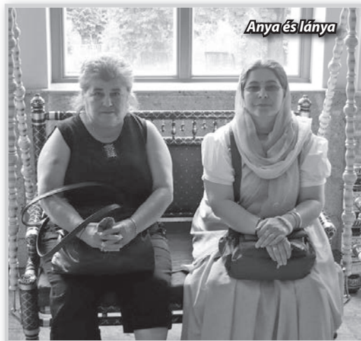
Anya és lánya