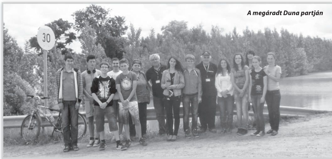
A megáradt Duna partján

iskolának, és belevetette magát a nyári programokba. A tehetséggondozó műhely résztvevői pedig ekkor végezték a munka nagy részét. Kitartóan küzdöttek az előttük álló feladatokkal és a kánikulával egyaránt. Örömmel nyugtázzhatjuk: NYERTEK!