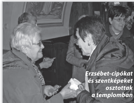
Erzsébet-cipókat és szentképeket osztottak a templomban

A projekt az Európai Unió támogatásával, az Európai Regionális Fejlesztési Alap társfinanszírozásával valósul meg.