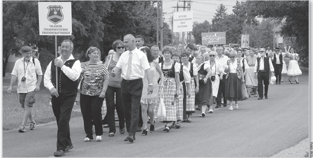
A menet a Bajcsy-Zsilinszky utcán vonult a szabadidőközponthoz

Délután a német népviseletbe öltözött hagyományörző csoportok a Penny-parkolótól a városháza előtti térre, majd onnan tovább a gála helyszínére, a Bezerédj Pál