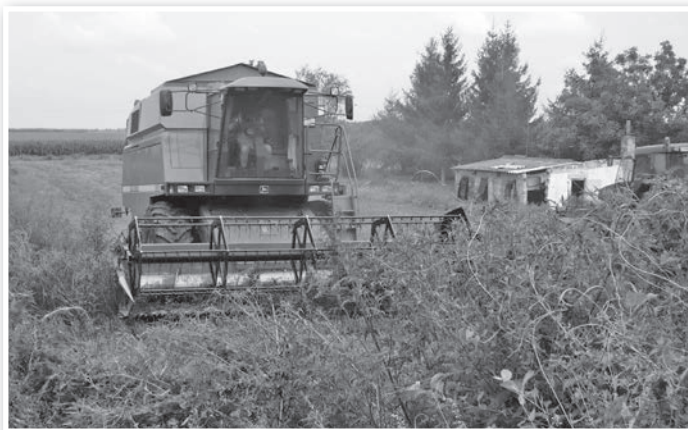
Az ideai aratás utolsó mozzanatai, harcban az esővel és a gyomokkal