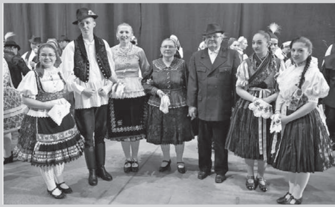
A Streer házaspár, táncosaik gyűrűjében

– Azóta az együttes sikert sikerre halmozott. Az együttes csak 2009-ig tízszor volt Németországban, háromszor Francia- és Olaszországban és a sorból nem hagyható ki Románia, Szlovákia, Lengyelország, Svédország, Belgium, Görögország sem, hogy a magyar hely-