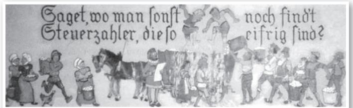
A tojást taposó svábok a bopfingeni városháza bejárata fölött látható képen

hajóján, a 2000 lóerős Princess Elizabeth-en, hogy pályája csúcán, a '70-es években felállhasson a Bayer Lloyd akkori zászlóshajójának, a Herzog von Tassilo-nak a parancsnoki hídjára is. Kétszer választották be a hajózási társaság