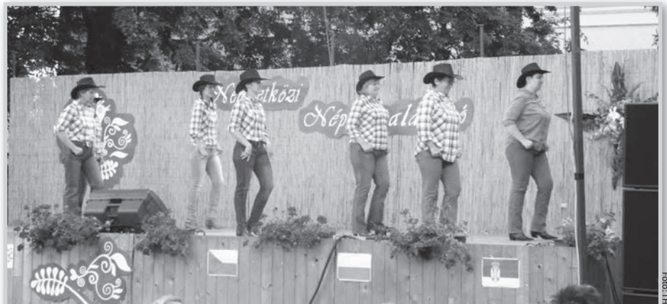
A táncfalalkozó színpadán a mözsi klub táncosai

Franciaországi, csehországi, lengyelországi, oroszországi néptáncsoport mellett a Mözsi Country Women Club is meghívást kapott a 7. Kisszállási Nemzetközi Táncfalalkozóra. A bemutatkozó csoportok országuk egy-egy tájegységének táncaival léptek a közönség elé. A mözsi nem magyar, hanem amerikai country zenére line dance formációt mutattak be, a közönség legnagyobb tetszésnyilvánítása mellett. A színes viseletüket felvonultató néptáncsoportok a színpadra remek hangulatot varázsolvá feledtették a nézőközönséggel a nyári forróságot.