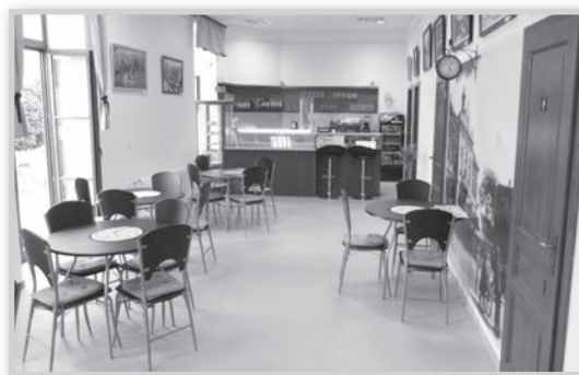
A Hősök terei cukrászda a hét minden napján várja a vendégeket

fagyizással koronázhatják meg a napot. Továbbá szerették volna, hogy a megújult téren is elérhetőek