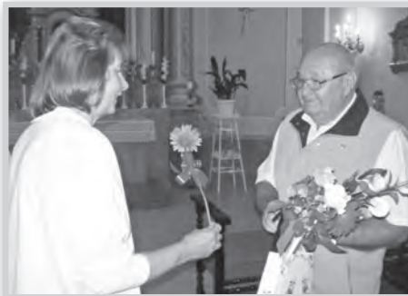
A szentmise végén köszöntötték az ünnepeltet

Szentmisén köszöntötte vezetőjét az egyházközség