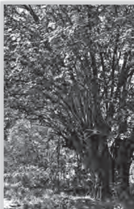
Ez az eperfa az alatta álló kisgyermek dédapjával lehet egyidős

Ez az öreg eperfa, a volt tolnai katonai lőtérré vezető út mellett, a lőtéri Páskomban található. Kora körülbelül 80-90 év, törzskörmérete 460 cm. Valaha ilyen eperfák szegélyezték az összes Tolnára bevezető utat, sok száz (vagy talán ezer is) lehetett belőlük. Az 1900-as évek elején ültették őket, meghozzá praktikus célból. A fehér eperfa ( Morus alba ) levele volt ugyanis a tápláléka a tolnai selyemgyár céljaira tenyésztett selyemhernyóknak. Ezen kívül az úton levők és gyerekek ingyen gyümölcse is volt, túlérett, lehullott (vagy lerázott) epréből erős és jó pálinka, fájából kiváló boroshordó készült. Mivel azonban levelét nem csak a selyemhernyó, hanem az az idő tájt behurcolt amerikai fehér szövőlepké is kedvelte, a hernyóselyem gyártásának megszűnte után e fákat is kivágták az országutak széléről. Mindet. Abból az időből, mint út menti sorfa csak ez az egy maradt meg Tolnában (jó volna tudni, hogy hogyan), mementóként az utókornak. Társai kivágása óta jó 40 év telt el, akkor ezek a fák fele ilyen vastagok sem voltak. Ha élnének, mostanra már azok is így néznének ki.