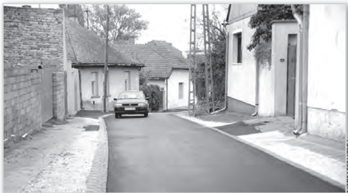
Simán lehet haladni a Malom utca déli részén is