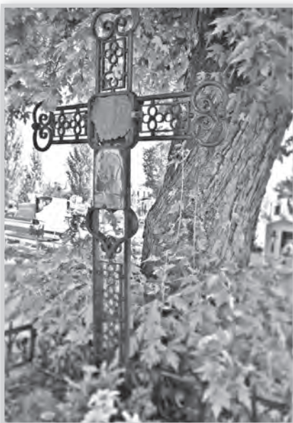
Tóth Aladár huszár ezredes méltatlanul elfeledett sírja a tolnai temetőben

– Az első dolog az az emberrel nem számoló mészárszék, ahová, példának okáért Bruszilov hajtotta a hadait. Döbentem olvastam a számokat. Ez iszonyat lehetett. A másik pedig, amin időnként felkaptam a fejem, az a szakadék, ami a tényanyag, vagyis a haditudósításokból utólag is rekonstruálható valóság, és a között húzódik, ami ebből az akkori napi sajtóban megjelent. Így utólag látva, bizony végighazudták a világháborút. Egy színes ideát festve a háború köré, a sötét és szörnyű valóságot eltakarva. Nincs szép háború! – fogalmazódott meg legvégül bennem. ka