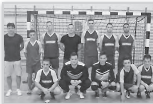
Főnyesen nyertek az Újpest ellen