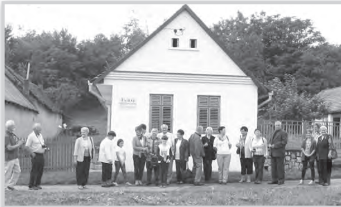
A mözsi kirándulók a geresdlaki tájház előtt

in Schomberg” feliratú tábla díszíti, jelezve, hogy Sombereken jelentős történelme van a svábságnak. A szépen felújított hagyományos tornácós házban a sváb paraszti élet rengeteg kelléke látható. Bútorok, textilák, használati tárgyak, melyeket a pincében, az istállóban, vagy a lakóházban használtak.