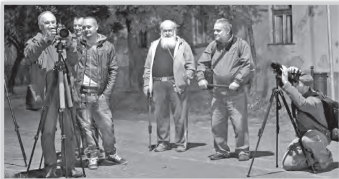
Éjszakai fotózás a városban

Negyedik alkalommal rendezték meg a fotós vikendet