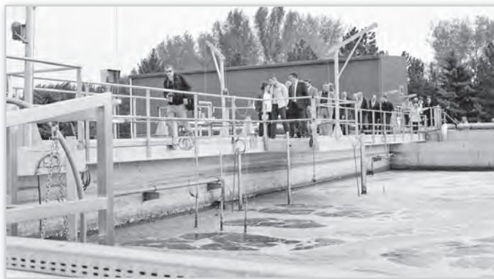
A beruházás átadásán résztvevő vendégeknek is bemutatták a korszerű szennyvíztisztító működését

A problémát nem csak a bűz okozta. A telep egyre kevésbé volt képes megfelelni – az EU-csatlakozás után még szigorúbbá váló – előírásoknak, a tisztított szennyvíz paraméterei meghaladták a határértékeket. A tolnai telep így erősen szennyezte közvetlen környezetét, és jelentős bírságot is kellett fizetnie a tolnai vízműnek.