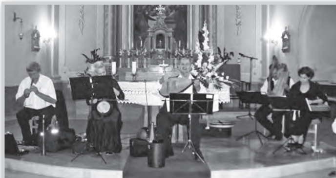
A Kecskés együttes különleges műsora nyitotta a programot

Néhány éve lehetőség van ezt is megtapasztalni, miután a múzeumok, színházak után egy meghátrázott napon sok helyen a templomokat is kinyitják éjjelre. És ha már kinyitják, hát be is csalogatják az embereket, ünnepi műsorok, koncertek, éjszakai áhítatok szervezésével, Tolnán is.