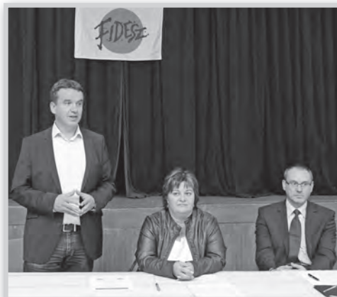
Horváth István (balról), Appelshoffer Ágnes és Zsigó Róbert

A képviselők bemutatása után Zsigó Róbert államtitkár kapott szót, aki a választáson való részvétel szükségességéről beszélt, és arról, hogy miért lenne fontos – vagy, ahogy ő fogalmazott, sorsdöntő – hogy a jelenlegi kormányt a választáson az önkormányzatok is megerősítsék. A fórum ezután lakossági kérdésekkel, illetve hozzászólásokkal folytatódott, illetve ért véget. ká