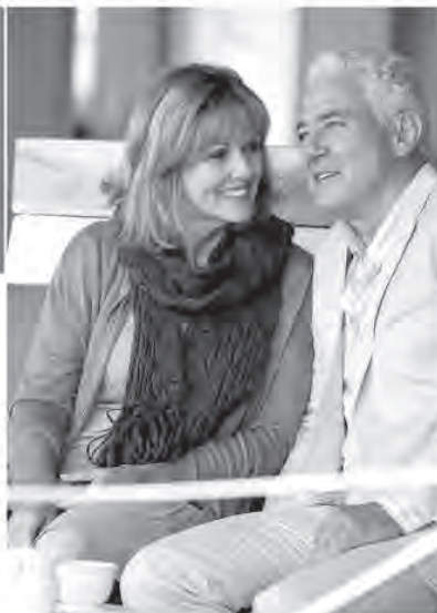
A hallókészülékek elfogadottsága érezhetően javult az elmúlt években.

Szerte a világon számos híresség gondolja azt, hogy a hallásproblémákat nem lehet a szőnyeg alá söpörni, és büszkén vállalják azt, hogy ők bizony hallókészüléket viselnek. A Dal-las sorozat Bobby Ewing-ját alakító Patrick Duffy például egy Egyesült Államokbeli hallókészülék forgalmazó reklámarca, de az Oscar-díjas Jodie Foster, vagy a tizenhatszoros Grammy-díjas énekes, Sting is sokat tesz azért, hogy szerte a világon tegyenek az emberek a hallásuk javításáért. A pozitív változás Magyarországon is elkezdődött. „A hallókészülékek elfogadottsága érezhetően javult az elmúlt években. Egyre többen gondolják úgy, hogy ha már a