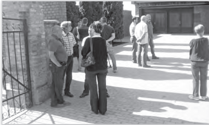
A tolnai ravatalozó előtti tér is megújult. A kép bal oldalán a két kivitelező cég vezetője

betartása mellett – a jövőben is arra törekszik, hogy ha van rá mód, elsősorban helyi vállalkozások kaphassanak munkát a városból. Hozzátette: a temetők esetében a következő lépésben a ravatalozók elé féltető építést tervezik.