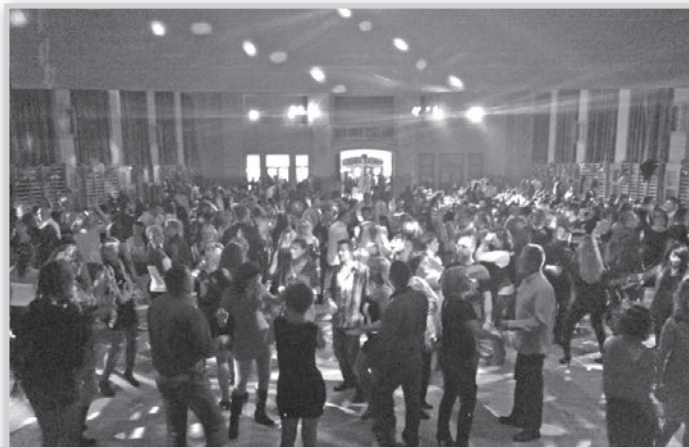
pillanatkép a szilveszteri lemezlovardából