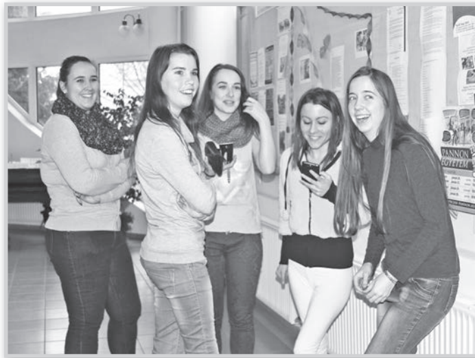
Szinte minden tolnai végzős gimnazista megtalálja azt az intézményt, ahová felvesszik

Az egyik osztályból egy tanuló kivételével mindenki a felsőoktatásban szeretne továbbtanulni, a másik osztályból többen választanak szakmát, de néhányan még