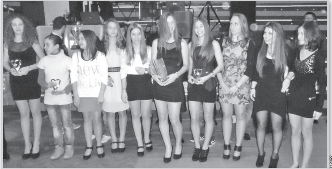
A díjazottak egy csoportja

A Tolna-Mözs Futsal SE az idén is megrendezte játékonysági bálját a tornacsarnokban. A korosztályok legjobbjai, valamint egy-egy edző, szponzor, támogató és szurkolói csoport is elismerésben részesült.