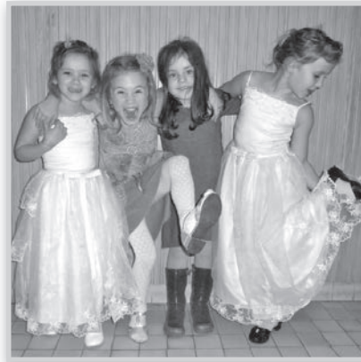
A női utánpótlás is jól érezte magát a bálon