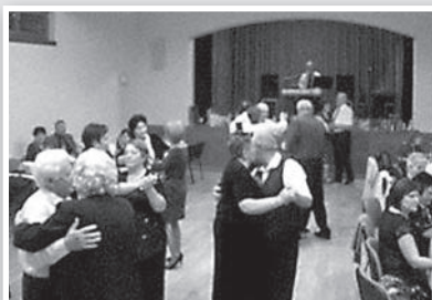
Hatvanon túl is van élet

Hatvanon és hetvenen túl is van élet, sőt! Január 5-én a mözsi kultúrházban tartott pótszilvesztert a tolnai Nyugdíjas Szabadidő Klub. A talp alá valót, mint mindig, most is Tausz János szolgáltatta. Az est folyamán örökzöld, nosztalgia- és mulatósdalok egyaránt felcsendültek, a vendégek együtt énekeltek régi kedvenceiket. Szülinapos köszöntés is volt megható percekkel, majd tombolasorsolás következett. Ropták a twistet, a kacsatáncot (a fájós lábúak, derekúak is). A Zorbanál szűknek bizonyult a terem, a folyosón is táncoltak.