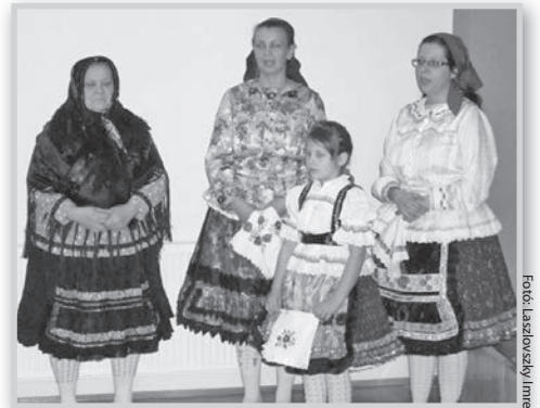
Élőben is bemutatták a bogyzslói viseletet

A megnyitón közreműködő Bogyzslói Hagyományörző Egyesület népdalokkal kedveskedett a jelenlőknek, emellett ünneplőbe öltözve mutatták be a bogyzslói viseletet. A közönség előtt állt teljes pompában