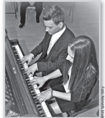
Az együttzenélés örömét is biztosította a találkozó

A Fusz János Zeneiskola immár tizenötödik alkalommal rendezte meg az ifjú zongoristák megyei seregszemléjét. A találkozón résztvevő növendékek eleget tettek az iránymutatásnak, és párosonként négy kézzel nem csak a legjobbat, de a szülő változathoz képest valóban kétszer annyit hoztak ki a zongorából.