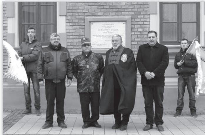
A koszorúzó a városháza falán elhelyezett emléktábla előtt