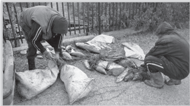
Több zsáknyi hal volt az orvhalászoknál