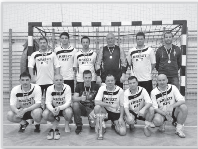
A Kriszt Kft. veretlenül nyerte a bajnokságot

A B-csoport állása lapzártakor: 1. Csel-szi 34, 2. Sárvíz-Autóüveg 32, 3. Izomix 29, 4. OLC 27, 5. Gernik 27, 6. Bori COO 22, 7. All-In 21, 8. Zsványok 7, 9. Rózsaszín Párduc 7, 10. VFC ifi 3 ponttal. Góllövőlista: 1. Tóth Attila (Sárvíz Autóüveg) 30, 2. Drézer László (Izomix) 24, 3. Jóföldi Tamás (All-In) 21 góllal.