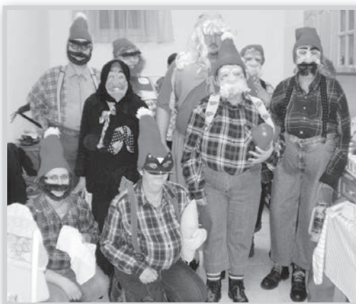
Más is megijedt volna tőlük, nem csak a disznó

Akkoriban minden disznóvágáshoz hozzátartozott a tél, a fagy, a hó, a csikorgó csizmák kopogása és a nagycsalád. Aztán jöttek szegényesebb disznóvágások is, az