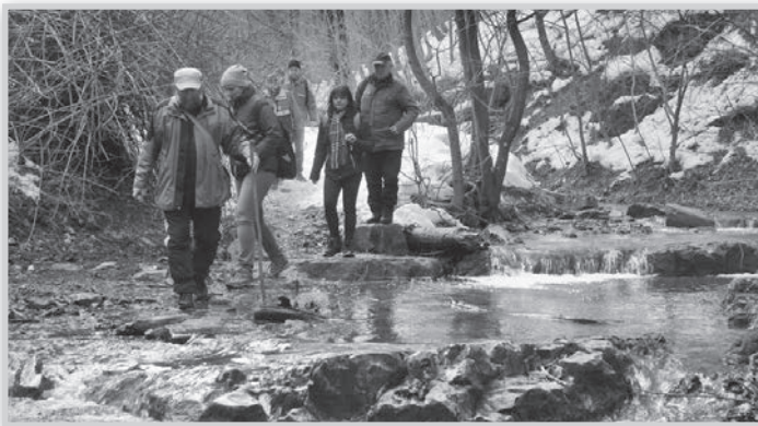
Havon-vízen át vezetett a TOVÁBB-osok által már sokszor megtett, de megunhatatlan mecseki út a kulcsosházhoz

a Tolna Megyei Természetbarát Szövetség elnöke méltatta a tudós természetjárót, majd megkoszorúzták a kulcsosház előtti kopjafát. Az eseményen a TOVÁBB Szabadidős Társaság mintegy húsz fős csapata is részt vett. A társaság tagjai az elmúlt évtizedekben számos alkalommal túráztak a Mecsekben, az óbányai Pataki-kulcsosházhoz is rengeteg szép élmény köti a tagságot.