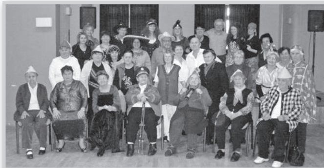
Farsang a mözsi idősek klubjában

■ Február 18-án a tolnai és a mözsi idősek klubja farsangbúcsúztatót tartott a Mözsi Művelődési Házban. A jó hangulatot fokozta a klubtagok és a gondozónők jelmezes felvonulása. A szintetizátoros zenére táncra perdültek a dolgozók és az idősek is. A gondozónők délelőtt közösen készített farsangi fánkkal kedveskedtek a tagoknak.