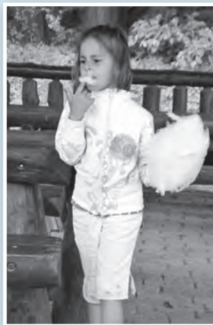
A gyereknapról a vattacukor sem hiányzott