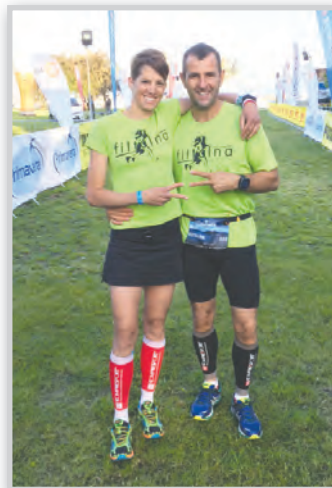
A nagyon fáradt, de boldog bronzérmesek