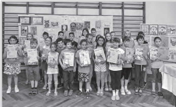
Több száz alkotás érkezett a pályázatra, huszonnégyen kaptak díjat

A rajzversenyre érkezett minden alkotás díjat érdemelt volna