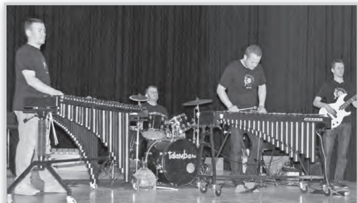
Sokféle ütőhangszert szólaltatott meg a Talamba