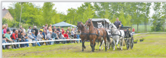
Négyesfogatot is láthatott a közönség a versenyen

A verseny lebonyolítását számos támogató segítette, így többek között a tolnai önkormányzat, az