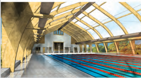
A tolnai tanuszoda látványterve