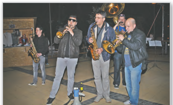
A BOSS a közönség közvetlen közelében fújta