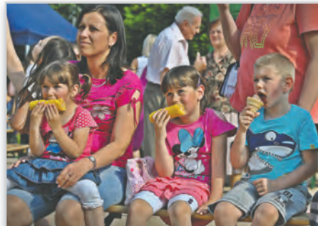
A kicsiknek is érdemes volt kimenni a térre

város címerét, de népszerű volt a pónilovaglás is. A kicsiknek tetszett, hogy a téren a „Duna” hullámozó vizében megmárhatták kezüket, lábukat (a szülőknek annyira nem). A színpadon Kovács Gábor muzikus zenés összeállítására csalogatta a gyerkőcöket, ámulva figyelték, ahogy hétmérföldes tarisznyájából sorra húzta elő a