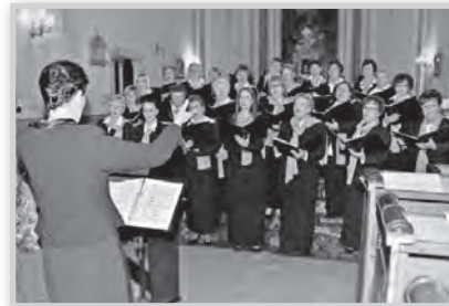
A Bartók kórus hangversenye a templomban