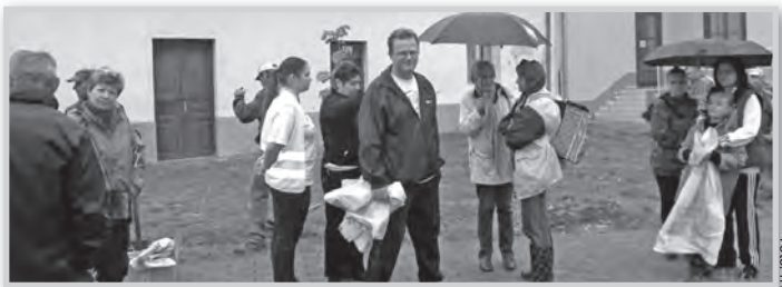
Esőben kezdődött a munka, de sokakat ez sem riasztott

Sikeres volt az első városi szintű szemétszedési akció