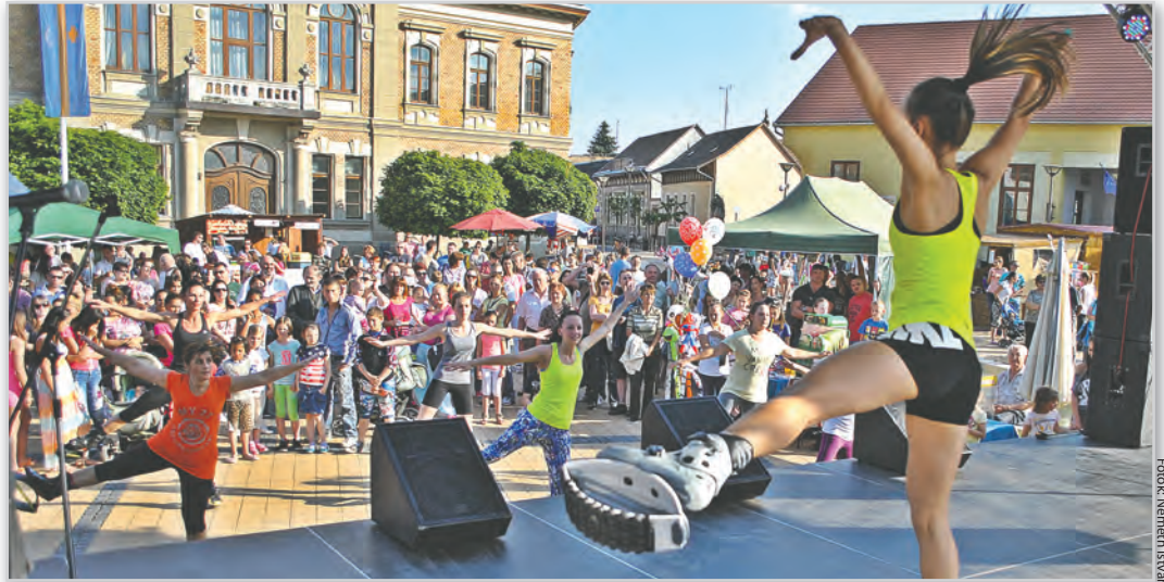
Látványos mozgás-produkciókat is láthatott a publikum

Őt Pécs legvidámabb bandája, a Boss együttes (Band of Streets) követte. A rézfúvós-dobos csapat karnyjá-