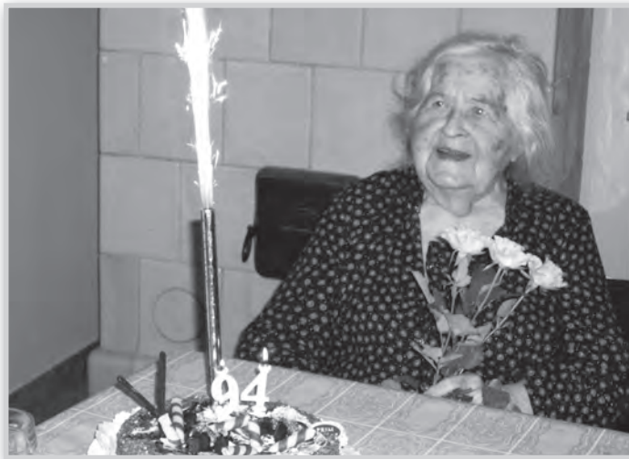
„Vili néni”, 94. születésnapján

mindenkiben a jót kereste és látta. Ha megpróbáltatás érte, méltósággal viselte, ahogy az öregedést is. Halála előtt néhány héttel sem tudott beletörődni, hogy egyszer el