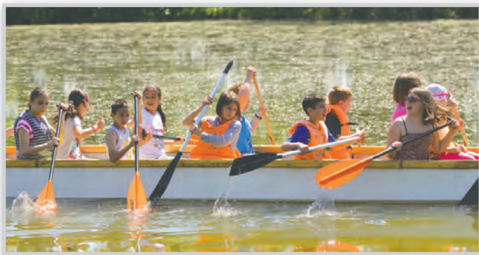
Fotó: Mátócsfalvi Dániel

A program a Szaladj az árral! elnevezésű közös Duna-parti futással indult, a résztvevőknek emléklap és műzli szelet járt. Igen népszerű volt az élő csocsó és a sárkányhajózás is, a Lapá-Tolna egyesület és a tolnai kajak klub jóvoltából. Link Kinga aerobik foglalkozása iránt szintén nagy volt az érdeklődés. Ahogy a labdázás, a rohangálás a parton, vagy a holtág vízhőmérsékletének lábbal történő ellenőrzése is vidám és kellemes időtöltésnek bizonyult a gyerekek számára.