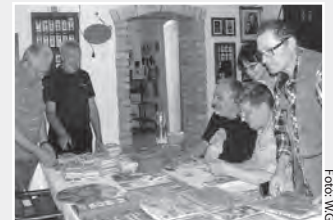
Jelvénybörze a múzeumban

jelvénymúzeumába is, ahol tárlatvezetést, börszét és árverést (jelvények, érmek, plakettek, szakkönyvek) tartottak. -Wy-