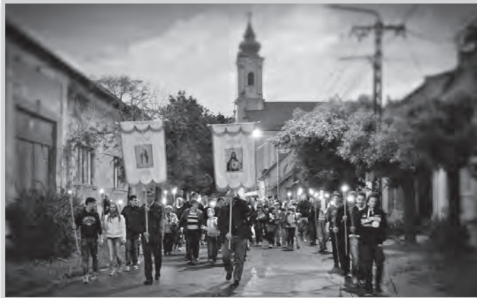
Fáklyás felvonulás a Duna-partra