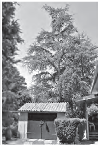
Atlasz cédrus a garázs felett

meg a barackosom sorsa. Nekem is ilyen lesz. – határozta meg el. 1973-at írtunk akkor – emlékezett vissza a házigazda.