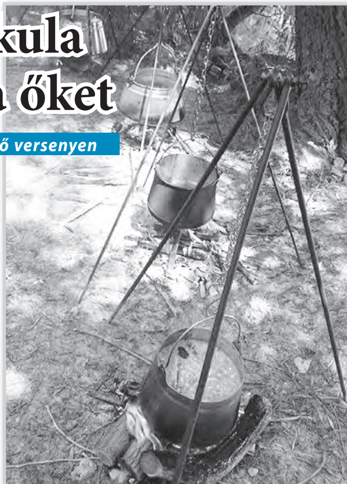
Huszonnyolc nevező közel két mázsa halat főzött meg

– Tavaly úgy váltunk el, hogy halfőző verseny mindenképpen lesz, csak még nem tudtátok, hogy hol. Akkor ugyanis tudott dolog volt már, hogy ez a terület kisajátításra kerül.