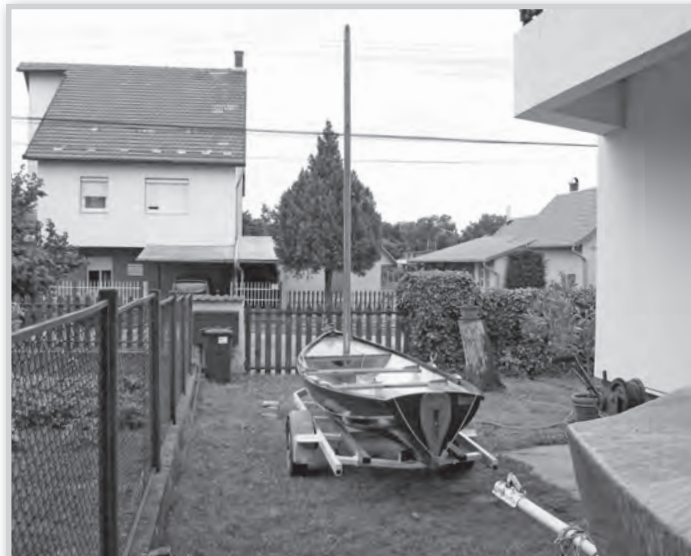
A „Mákvirág” útra készen

seregszemlére, amelyben nem elsősorban a megmérettetés szándéka motivál – mondta a kapitány. – Ez egy egyszerű csapat, egy kiváló közösség, amelynek tagjai ugyan hivatalosan amatőrök, de kivétel nélkül mind a hajók és a víz szerelmesei. Mint én. Ráadásul zömében