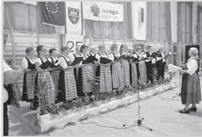
Az ünnepelt kórus a jubileumi rendezvényen