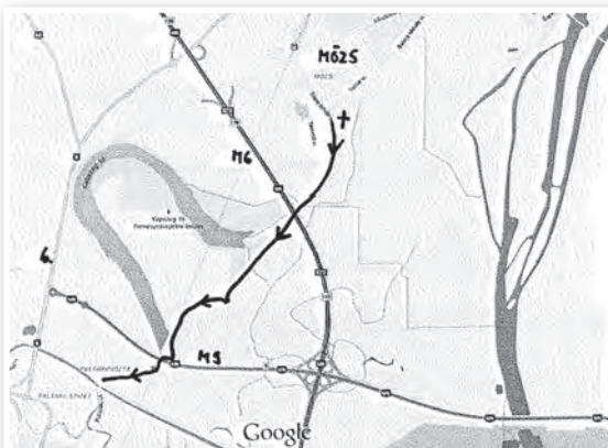
A Tolna (Mözs) és Szekszárd (Palánk) közötti zárandok útvonal

Augusztus 22-én Tolnáról két irányban nyílik lehetőség a zárandokút megtételére a kijelölt turista utakon, gyalogosan vagy kerékpárral.