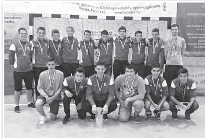
Az országos 3. helyezett U17-es fiú csapat