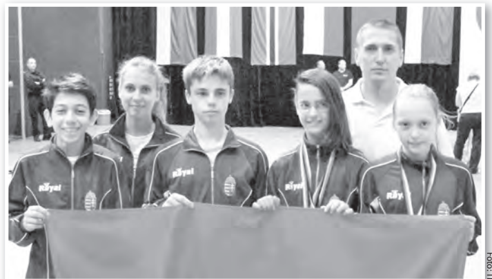
A bochumi EB-n is eredményesen szerepeltek