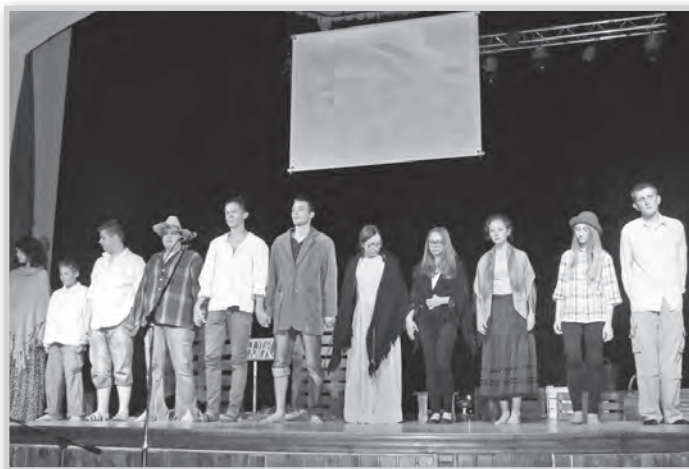
A Sztárai gimnázium színjátszói legutóbb, június 4-én a trianoni megemlékezésen léptek fel