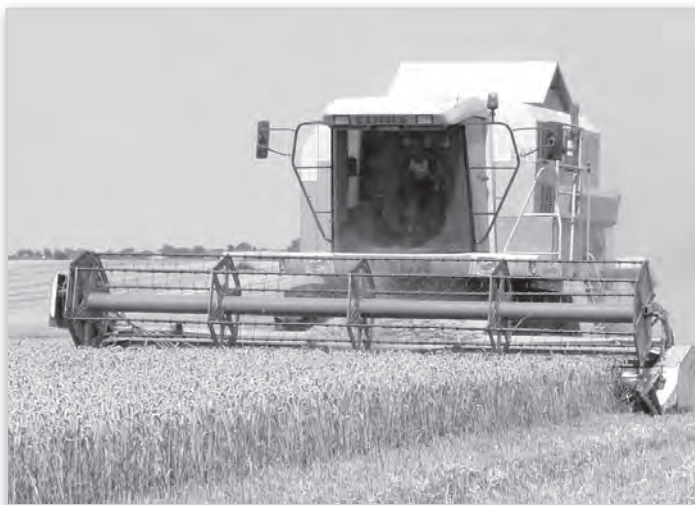
Aratás a mözsi határban

– Nem, változott a termelési szerkezet. Társaságunk 1100 hektárt művel, abból 700-at tesz ki a kukorica és a búza. A krumpli az egyéb növények közé került, mint a borsó. Ezek összeszűrt területére mindössze 50 hektár. Korábban 200-250 hektáron is vetettünk burgonyát, de az olcsó lengyel krumplival, amivel az orosz embargó miatt elárasztották az országot, nem lehetett versenyezni. A nagy feldolgozókkal nehézkes volt a megegyezés, több tonna a nyakunkon maradt, ki kellett dobni. Most bízunk abban, hogy ezt az ideit, kisebb készletet helyi akciózással értékesíthetjük.