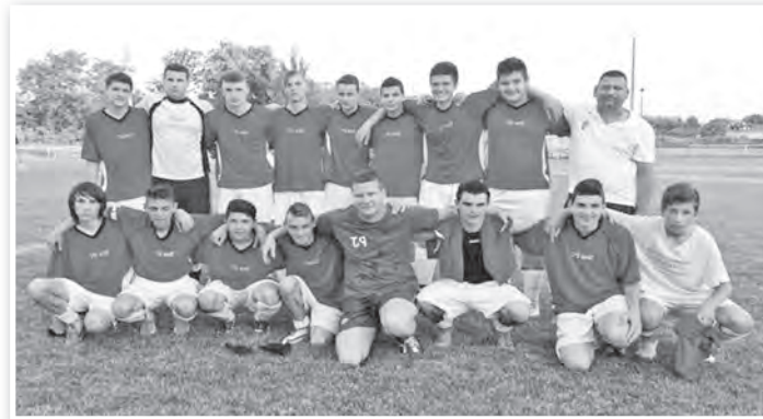
A megyebajnok U17 csapat

A téli terem- és futsal tornákon több dobogós helyezést ért el a csapat. Júliusban pedig Közép-Európa legnagyobb utánpótlás tornáján vett részt a csapat, ahol dél-amerikai, afrikai és európai csapatok ellen is pályára léptek.