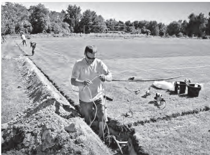
Két hét alatt elkészült a futballpálya új öntözőrendszere

A beruházás – aszályos időjárás esetén – három éven belül megtérül.