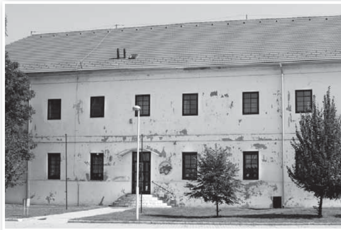
A zeneiskola épületének tetőfelújítása elkészült, következhet a homlokzat

módon, a nyilvánosság teljes körű biztosításával, közmegegyezésre működő alapítvány szakmai programja pozitív elbírálásban részesült. A Miniszterelnökség az eddigieknél