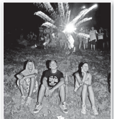
A közelgő vihar miatt kicsit korábban zajlott a tűzijáték