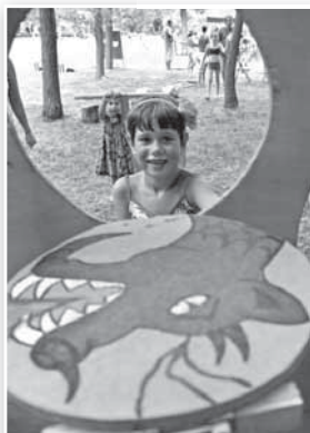
A Népi Játékok Fesztiválja népszerű volt a gyerekek körében

Nagy sikert aratott a HoneyBeast élő koncertje. A magyar zenei paletta jelenleg egyik legtehetségesebb zenekara dalaival tükröt tart a társadalom elé, ráadásul szöveg, ritmus, zene jól együtt van. Tolnán is tömegeket vonzottak a színpad elé. Az ismert dalok sorban követték egymást, köztük a 2014-es év legnagyobb slágere, A legnagyobb hős. A pénteki program videodiscoval (Pike) zárult.