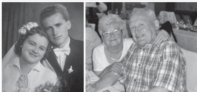
A Völgyes házaspár egykor és ma

Az ország az államalapítást, a tolnai Völgyes házaspár család-alapításukat ünnepli augusztus 20-án – immár hatvan éve.