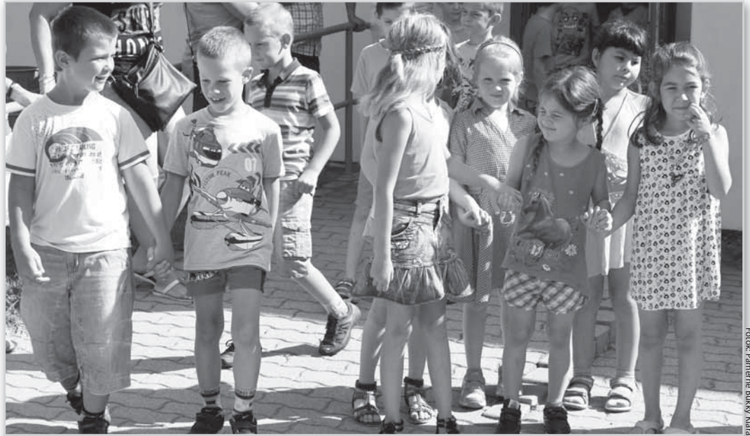
Az iskolára hangolódtak az elsősök a nyári vakáció utolsó napján az Eötvös utcai iskolában