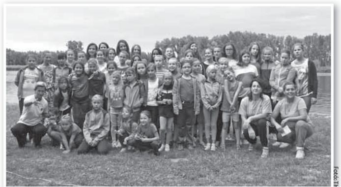
Közel ötven gyermek táborozott Domboriban

Csapatépítő táborozáson vett részt a Tolna KC utánpótlása