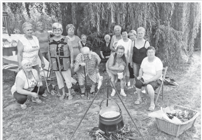
A nyugdíjas érdekszövetség csapata lett a harmadik

Ezzel együtt a legóvatosabb vezetés mellett is megtörténhet a baj. A féktávolságon belül észlelt vad megjelenése esetén nemigen lehet mást tenni, mint erőteljesen fékezni és használni a jármű hangjelzését. Ha megsérül a jármű, megállás után azonnal értesíteni kell a rendőrséget. A hatósági intézkedés ugyanis az esetleges kárigény benyújtása miatt is elengedhetetlen.