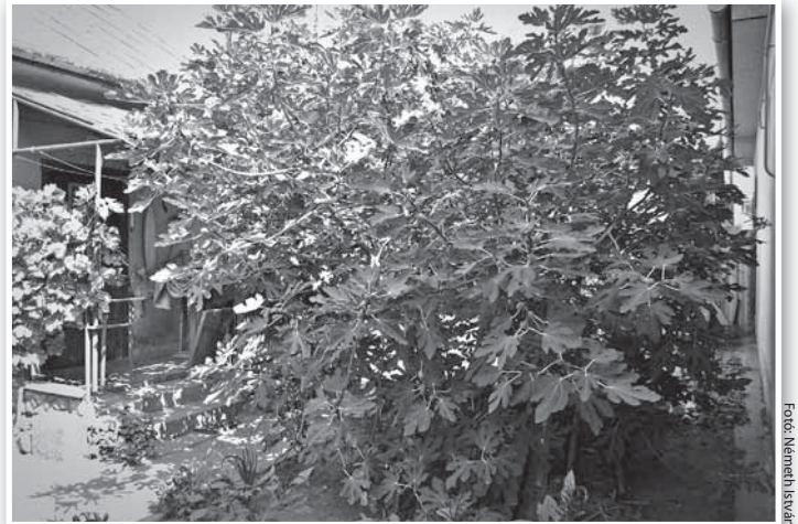
Már nem ritkaság a füge Tolnán sem

A Gellért hegy déli lejtőin már a török idők óta terem a füge. Talán épp a törökök hozták be először. Mindenesetre az emberiség legősibb gyümölcsceineke egyike. Már a Biblia is gyakran említi, a római birodalomban pedig az aszalt füge egyenesen népelelmzési cikk volt. Két fő természetett változata van, az adriai – ez van nálunk – és a szmirnai, ami viszont nem hoz termést a mi éghajlatunk alatt. A beporzáshoz ugyanis egy aprócska rovar, a fügedarázs kellekik, ami nem bírja ki a mi tele-