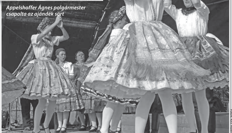
Színvonalas folklórműsor is zajlott a vízszínpadon