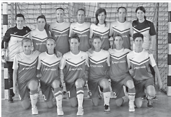
Az ezüstérmes Brand Mission Tolna-Mőzs csapata