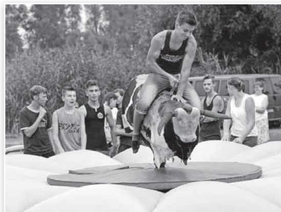
Jó erőpróba volt a múbika

A vízi színpadot népviseletbe öltözött táncosok, zenészek, énekesek foglalták el, a Tolna-Mőzsi Bukovinai Székelyek Baráti Köre által rendezett Székely-Magyar Nap című folklórprogram során. A délután folyamán Tolna megyei néptáncsoportok (Decs, Kakasd, Tengelic,