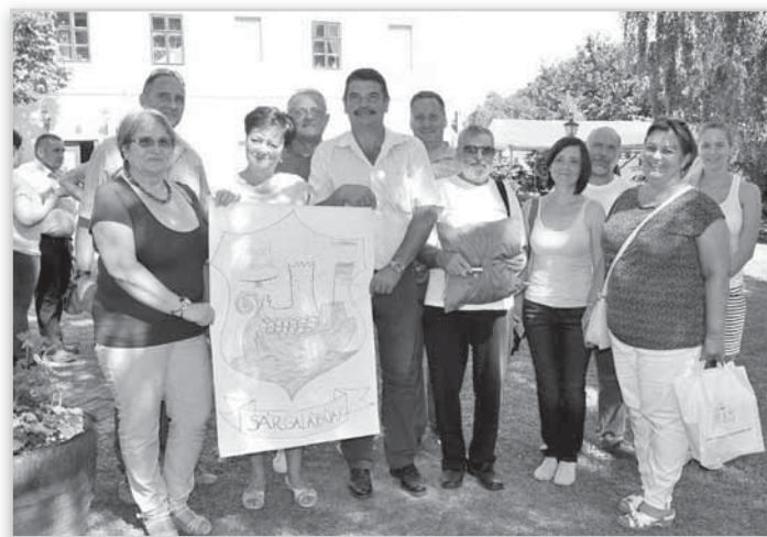
A tolnaiak a rögtönzött csapatcimerrel a kölesdi Kismegyeháza udvarán

lét és rétest készített. Az ételek nagyon népszerűek voltak a tolnai standon megforduló vendégsereg körében, a halászléből pedig még a zsűri elnöke is kért egy adagot