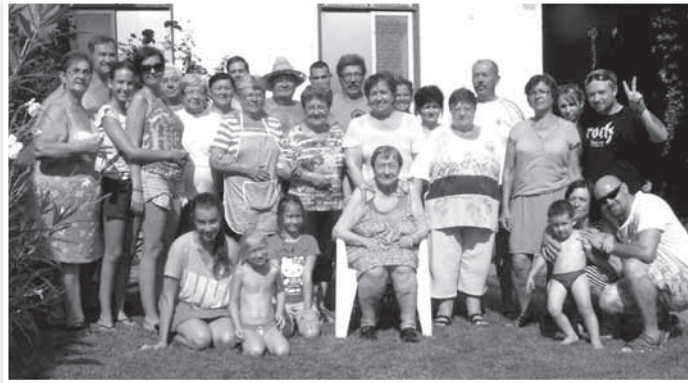
Idén több, mint harmincan jöttek el a családi találkozóra

– Ilyen volt a csendőrelét. Apánk egyébként a ma Romániához tartozó Nagykárolyban született, és Diósgyőrből Bogyzlóra vezényelték, az ottani csendőrsre. Onnan