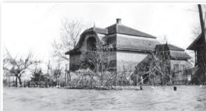
Apadóban az ár. A sötét csík az ablakok felett a tetőzött vízszintet mutatja a Mészáros tanyán

Reggel aztán megindult a „vízi forgalom”. Motorcsónakokon, halászladikokon katonák jöttek Tolna felől, menteni. Hozzánk is bekiabáltak, hogy tudnak-e segíteni? Nem szorultunk rájuk, élelem, ivóvíz, tüzelő volt bőven a padlásra, sőt, egy idő után már mi váltunk egyfajta alkalmi segélyhelylé,