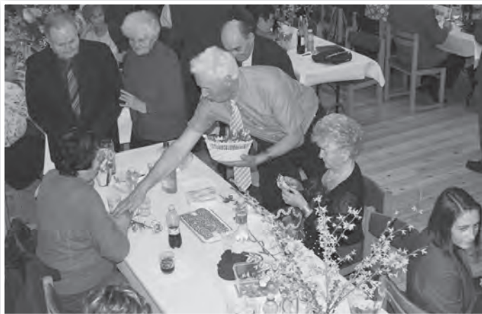
A nőnap alkalmából minden hölgynek virágot és apró ajándékot adtak át

Am a klub nem csak a hölgyek-re, hanem a férfi tagjaira is gondolt. Április 4-én férfinapot tartottak a lovarda színpadán, ahol Appelshoffer Ágnes köszöntötte az erősebbik nem képviselőit. A polgár-