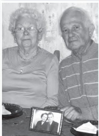
Egymáshoz és a munkahelyükhöz is hűek voltak

Így legyen! És örüljenek még nagyon soká egymásnak! ká