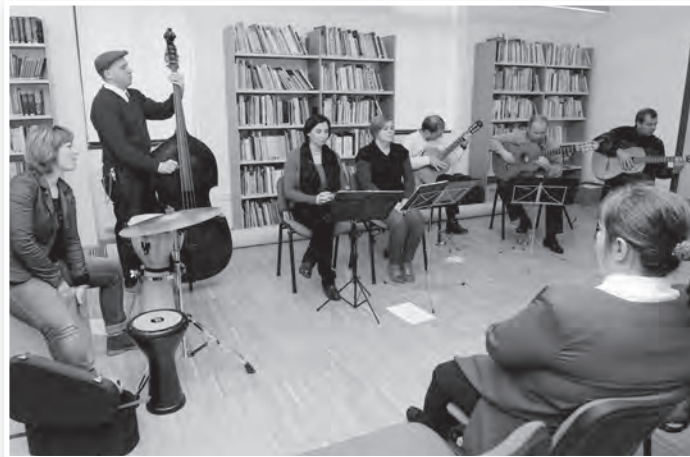
A kibővített Szekszárdi Gitárkvartett emlékezetes koncertet adott

Húsvét előtt egy örömteli karácsonyi dallal (Los Peces) búcsúztak, amelyben boldogok a halak, mert