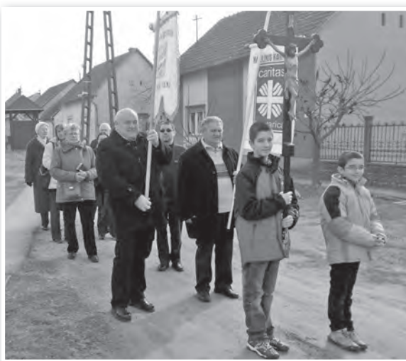
Őseink is ezen az úton indultak

út menti kőkeresztnél – az iskola előttinél – megpihenve és imádkozva, immár a mözsi harang-