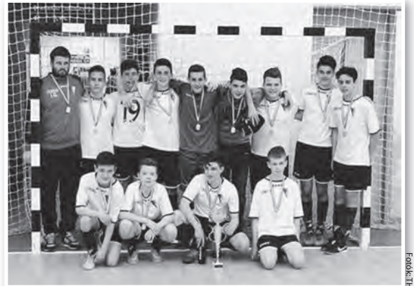
Tolna VFC kupagyőztes U-7-es csapata és megyei bajnok U-15-ös csapata

maradt alul a döntőben a Dombóvár csapata ellen. A Tolna VFC U-10-es csapata (1 évvel fiatalabbak voltak a többiekénél) 4. helyen végzett, a „kis-döntőben” 2-1-re kaptak ki a Bonyhád VLC U-11-es csapatától.