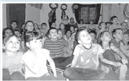
Madárfotó-vetítés is színesítette a felkészülést

A cél a természetvédő magartás tanítása mellett, hogy a következő nevelési évben a selyem Óvoda is Madárbarát Óvodává váljon.