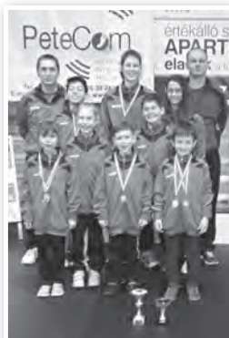
A sárvári versenyen is eredményesen szerepeltek