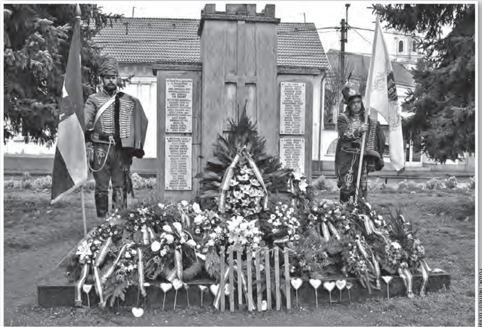
Koszorúk a tolnai '48-as emlékműnél

is példátlan nemzeti összefogásra emlékezve. Hogy mindez akkor mire volt elég? – tette fel a kérdést a szónok. – Majdnem mindenre! A függetlenség kimondására és a polgári átalakulás harcos igénlésére mindenképp, s mindehhez még, egy, a semmiből felálló, ugyanakkor európai szintű hadsereg létrehozásához is. Március 15 fénylő csillaga alatt még az is lehetséges volt, hogy Görgey 30 ezer honvéddal is sikerrel szállt szembe Paskiewicz 150 ezres hadával.