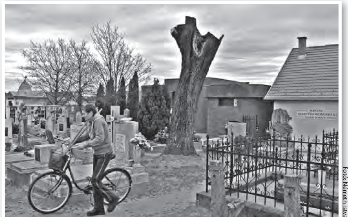
A ravatalozónál kivágtott fát már pótolják

Cége tíz temetőt üzemeltet. A veszélyes fák kivágására mindenütt odafigyelnek, s hangsúlyozza, hogy a telepítést is ugyanilyen fontos feladatuknak tartják. Az igazán „temetőbarát” fa a gömbkőrös. Nem nő túl nagyra, de azért ad árnyéket. Stabilan kapaszkodik a földre, de nem fejleszt veszélyes méretű gyökérzetet. A tolnai temetőbe is ilyeneket ültetnek most, nyolcat-tízet. -WY-