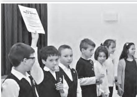
Részlet a mözsi iskolások műsorából

Ezután lépett az ünneplő közönség elé Appelshoffer Ágnes polgármester, aki egy Garay János versidézzel vezette be ünnepi beszédét. Amiből kicsengett, hogy a százados múlton is átragyogó „régifény” az, ami világít és melegít ebben az ünnepben. Világít, az akkor kijelölt utat máig mutatva, és melegít is, az azóta