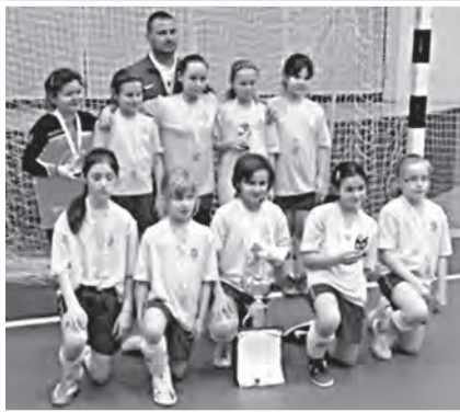
A TMFSE U9-es csapata

Mivel az idén nem sok lánycsapat nevezett, az U-7, U-9 és U-11 korosztályban a Tolna-Mőzsi Futsal SE lányai fiúcsapatok ellen tesztelték tudásukat. Igen sikeresen, hisz az U-9-esek között a tolnaiak aranyérmeket szereztek. Az ifjú höl-