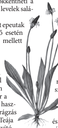
A lándzsás útifűből remek köptető készíthető

Közönséges nyír: teához a már kifejtett, de még új leveleket szedjük. Vizelethajtó, lázcsillapító, vértisztító, a veseműködést szabályozza. Vesehomok és vesekőképződést gátló hatású. Kiváló szer húgyúti fertőzésekre, hólyaghurutra, felfázásra. Napi 1-3 csésze teát fogyasztunk a húgyúti problémák kezelésére. Egy csészéhez egy csapot evőkanálnyi levelet kb. 2,5 dl vízzel forrázunk le, és legalább 10 percig áztassuk a vízben! Utána fogyasztható. Vigyázat! Nagyon ritkán, de allergiás reakciókat okozhat! Link Judit